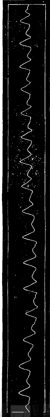
Rys. 4. Zupelnie normalne tętno tegoż chorego nazajutrz po stwierdzonej embryokardyi.

[TANQUEREL]. Nie należy jednak do częstych objawów zatrucia łożnianego.