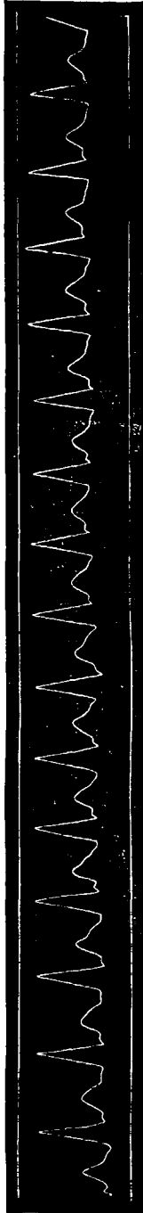
Rys. 3. Toż samo tętno po dalszym działaniu amyl-nitrytu.