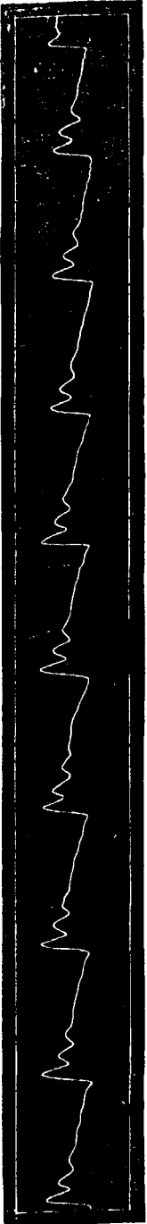
Rys. 1. Tętno chorego A. S., 1 w godzinę po przybyciu do szpitala.

ciu łożnianem. Dla ścisłości zaznaczymy tu, że niemiarowość tętna zwyczajna oraz jego dwubitność była już i dawniej przy kolce łożnianej notowaną.