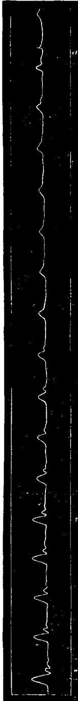
Rys. 2. Tętno tegoż chorego po minutowym działaniu amyl-nitrytu.