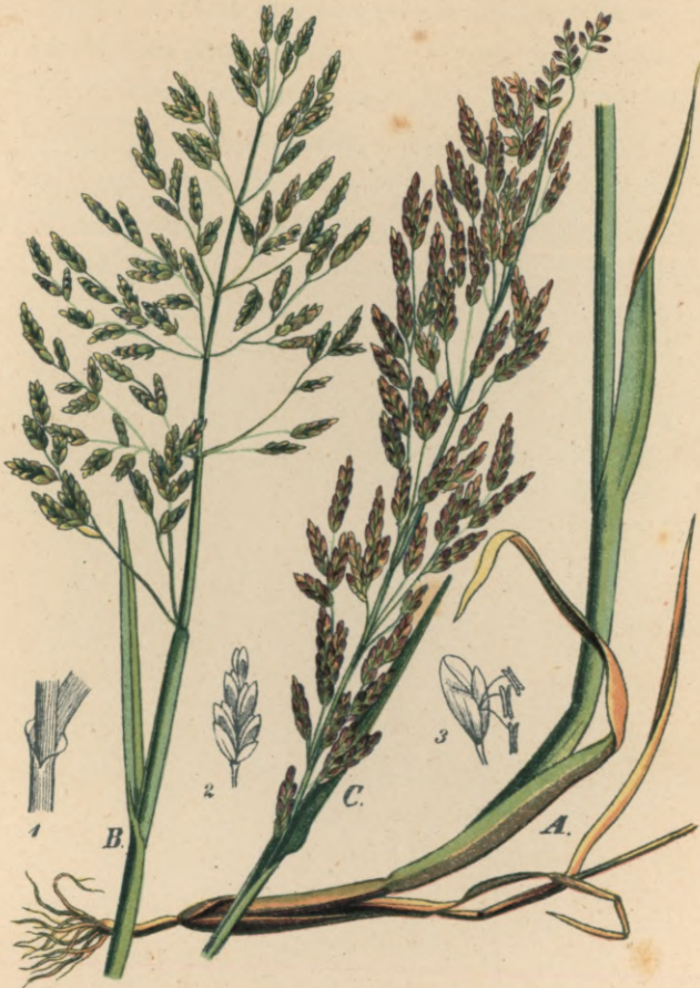
713. Glyceria maritima M. K. Meerstrands-Schwadengras.