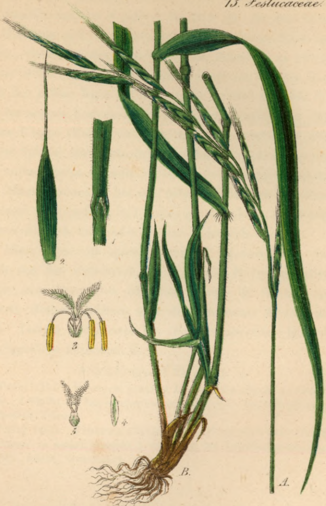
146. Brachypodium silvaticum R. Sch.