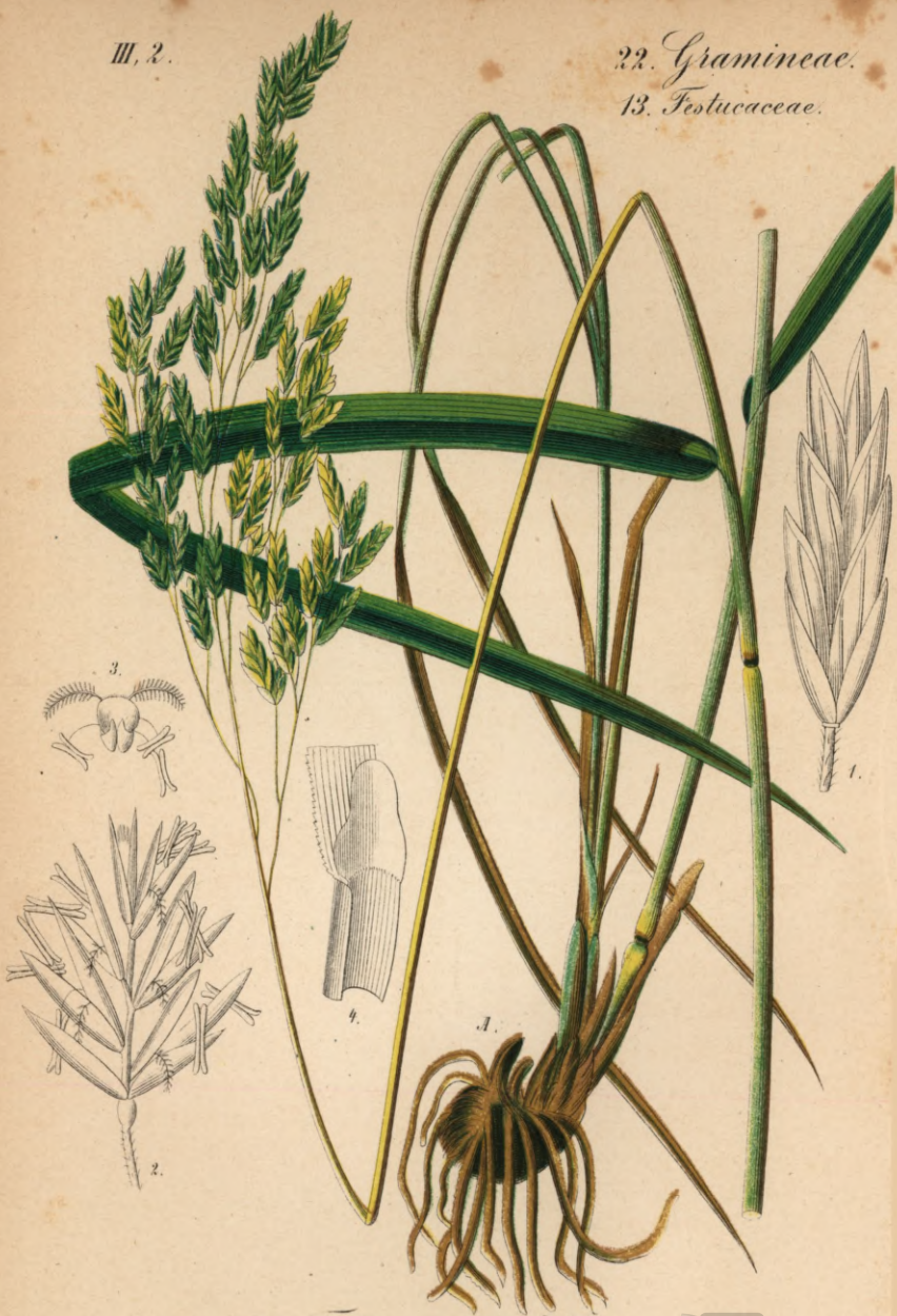
138. Festuca spectabilis Zan.