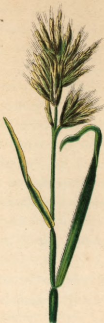
754. Bromus confertus M. B. Gedrängtrispige Tresp.