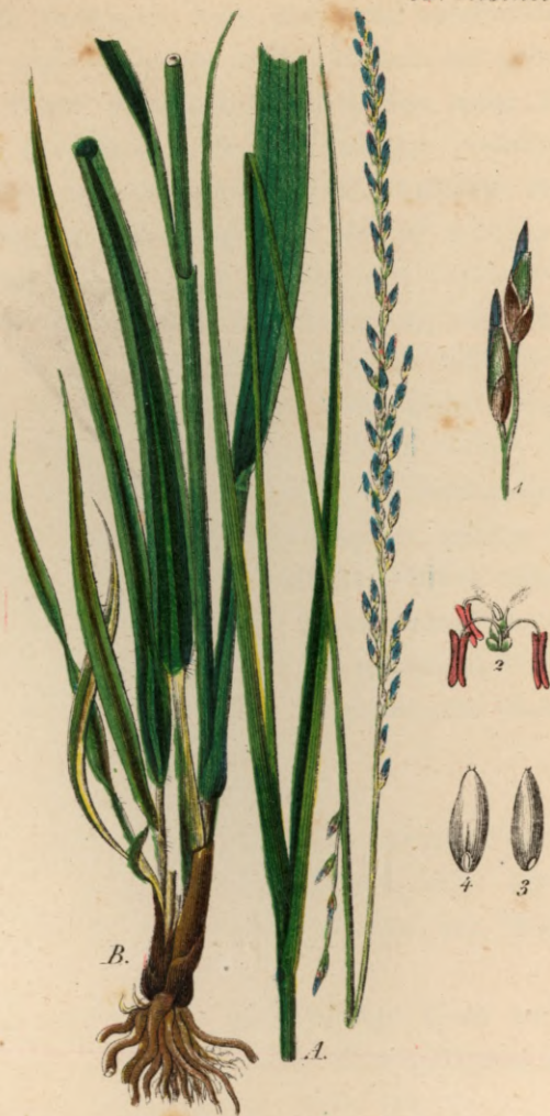
715. Molinia caerulea Monch.