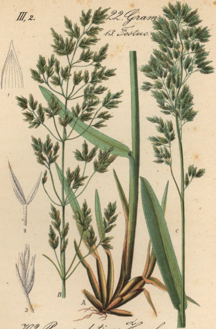
702. Poa sudetica Haenke. Sudeten - Rispengras.