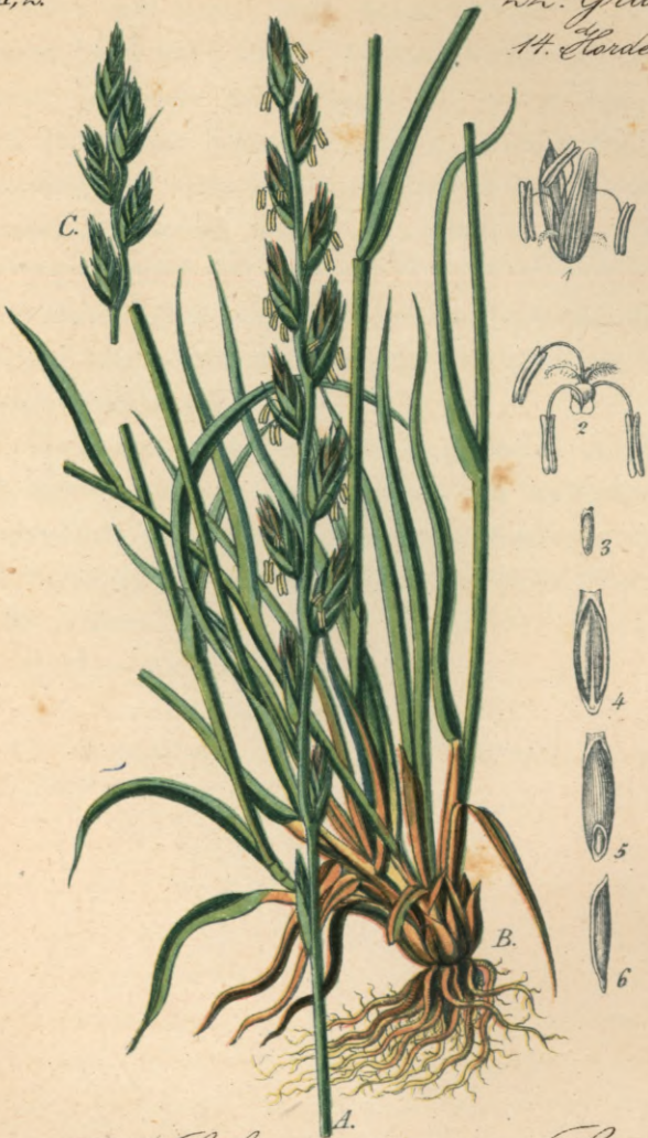
495. Lolium perenne L. Colch.