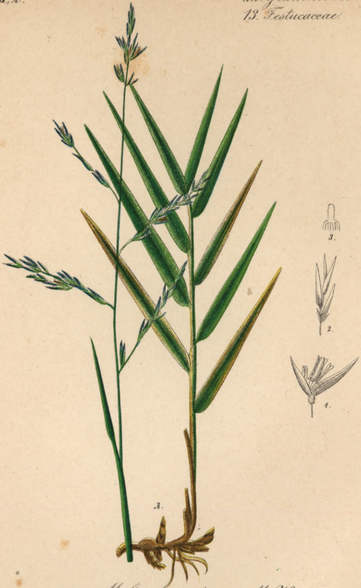
717. Molinia serotina M. H.