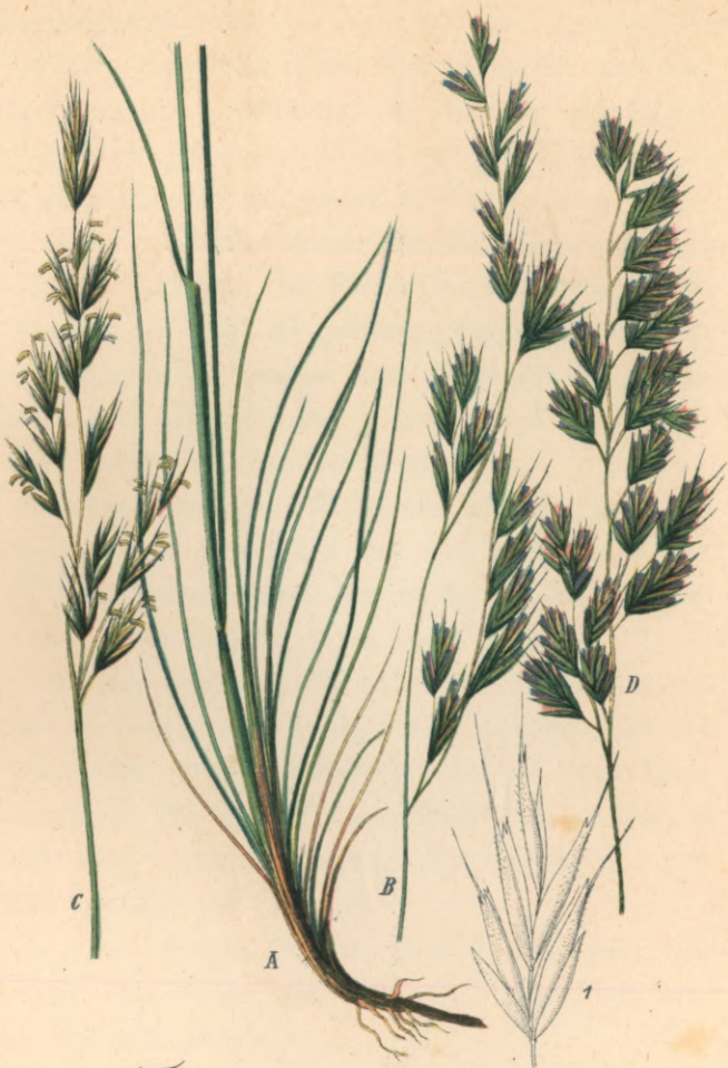
130. II. Festuca ovina duriuscula L. Harter - Schafschwingel.