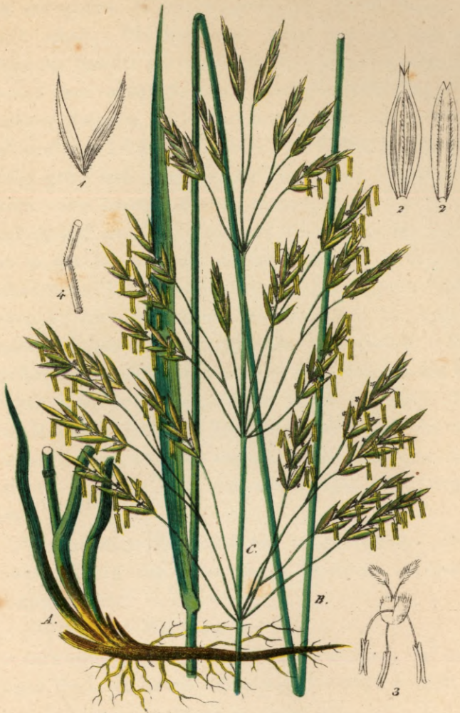
160. Bromus inermis Leysser. Grannenlose Trespel.