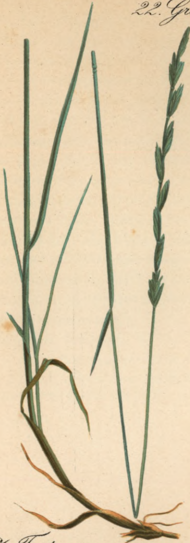
III Triticum pungens Pers. Stechende Quecke.