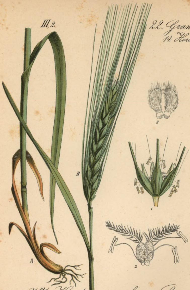
187. Hordeum vulgare L. Gemeine Gerste.