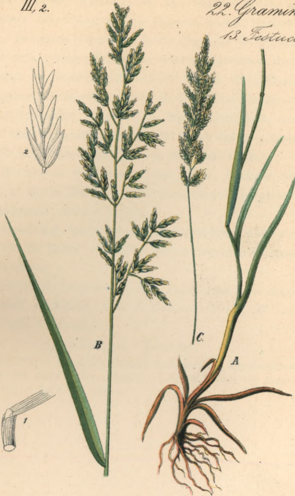
Poa compressa L. Mauer-Rispengras.