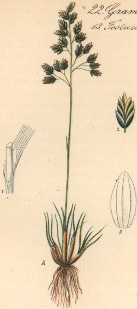
695. Poa pumila Host. Niedliges - Rispengras.