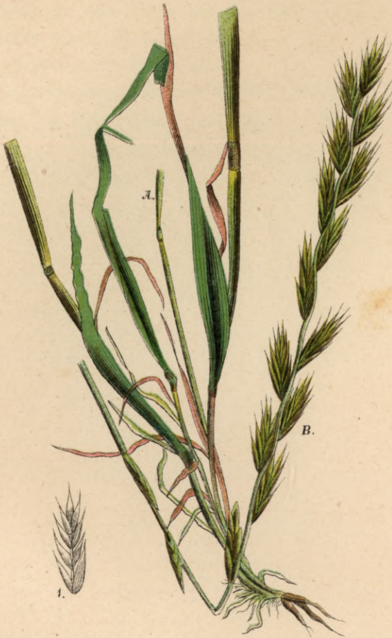
196. Lolium italicum Braun.