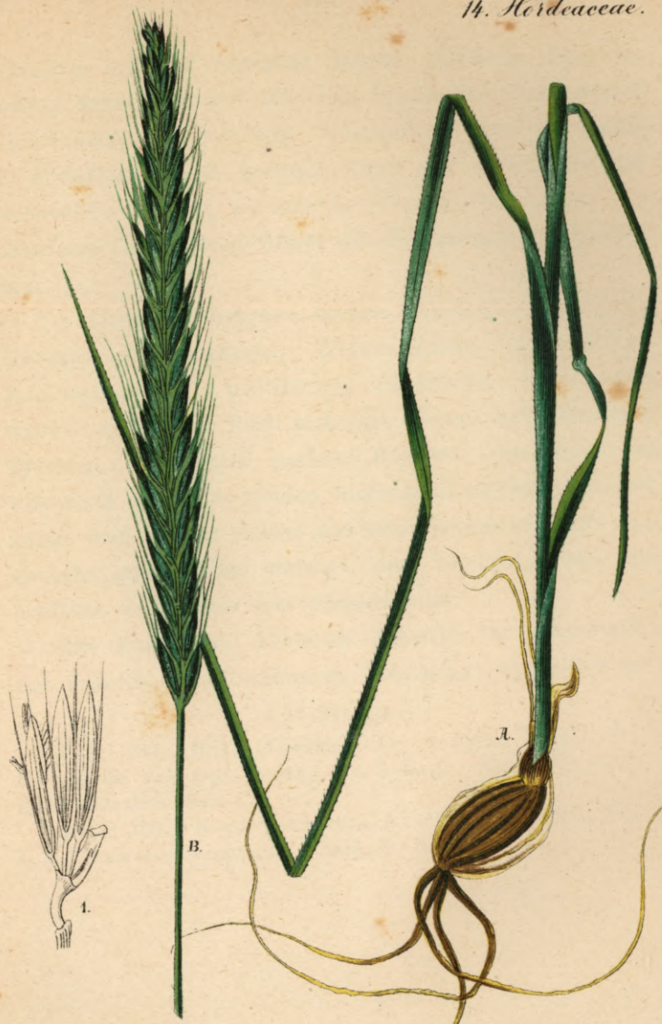
791. Hordeum strictum Desf.