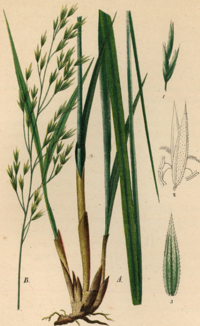
739. Festuca silvatica Vill.