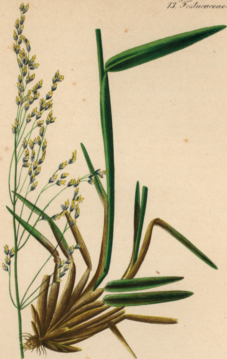
703. Poa hybrida Gaud. Bastard - Rispengras.