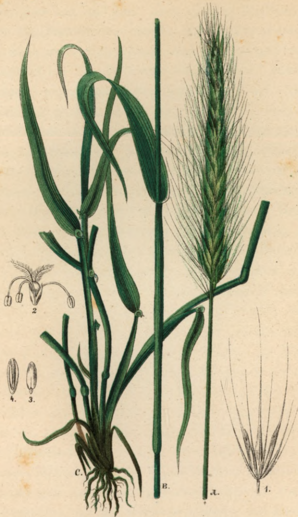
792. Hordeum murinum L.