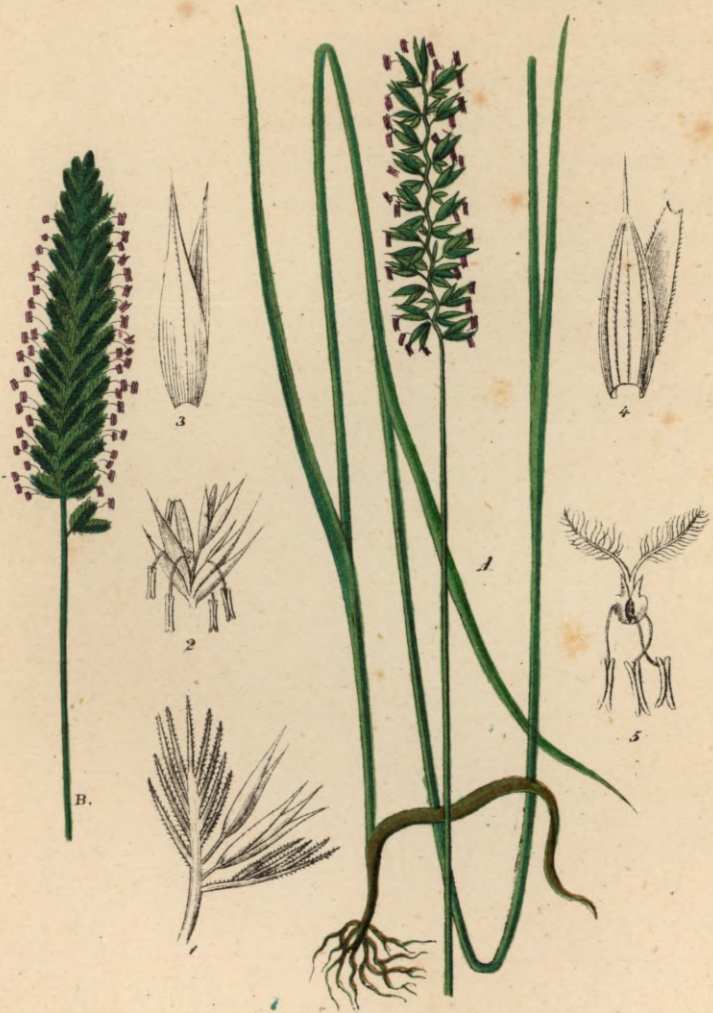
720. Cynosurus cristatus L.