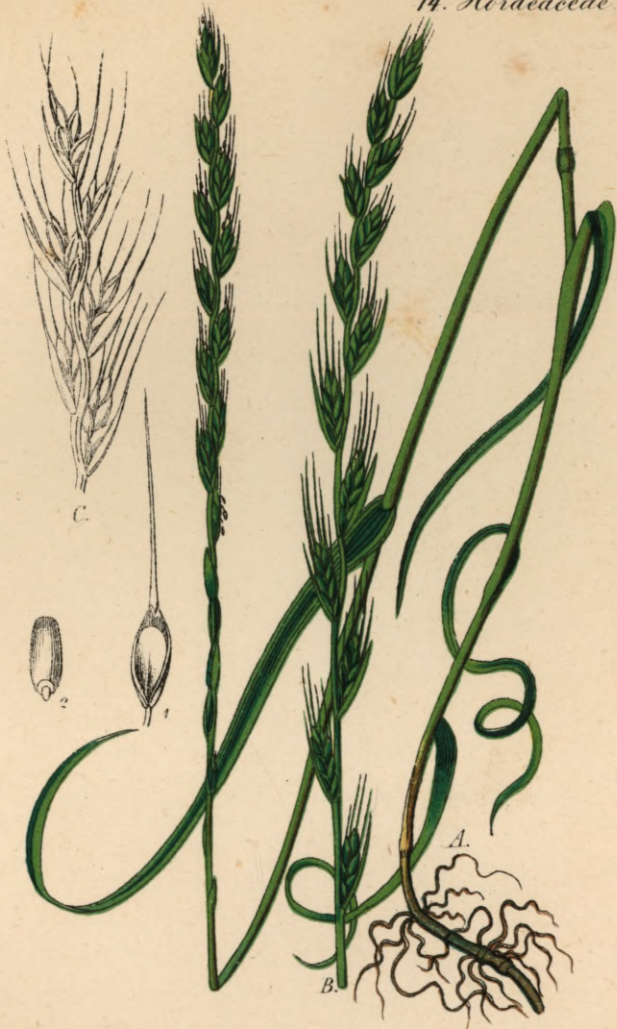
800, 1. Lolium temulentum L.