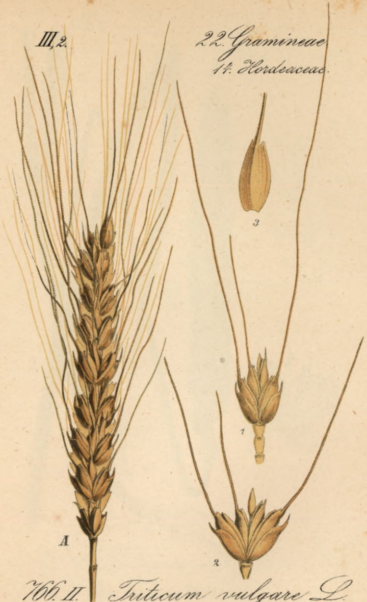
166. II. Triticum vulgare L.