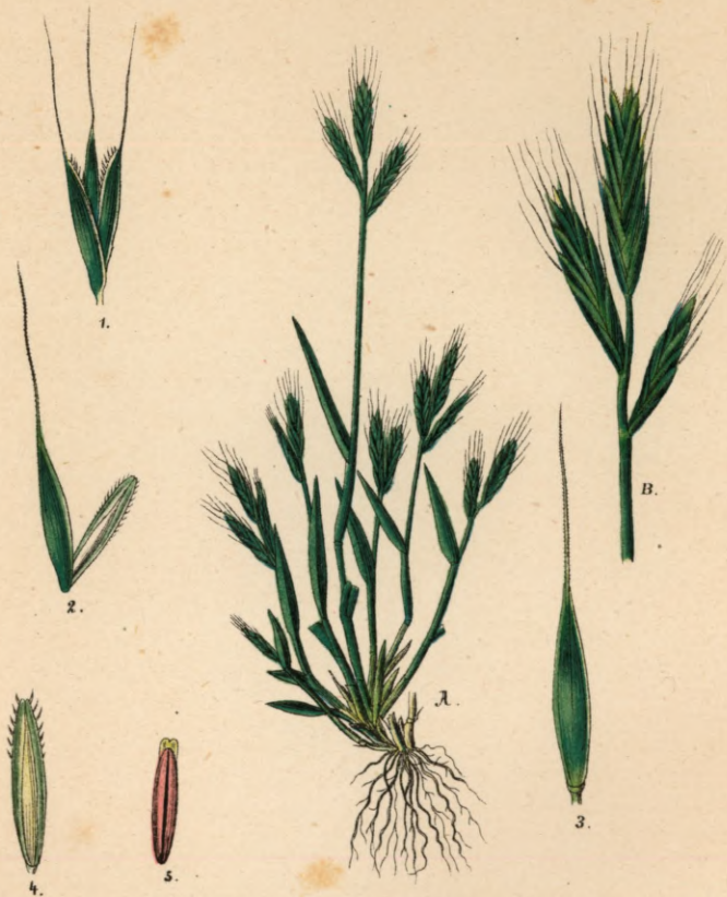
149. Brachypodium distachyon R. S.