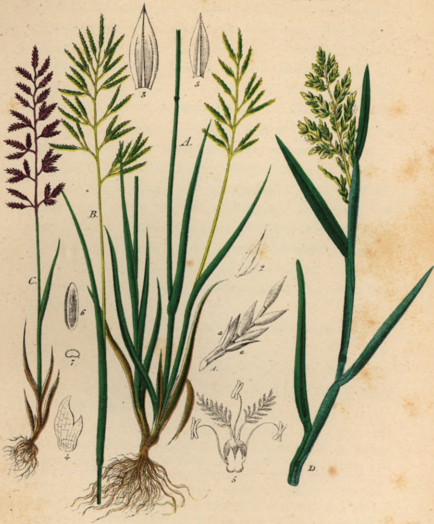
724. Festuca rigida Kunth. Starrer Schwingel.