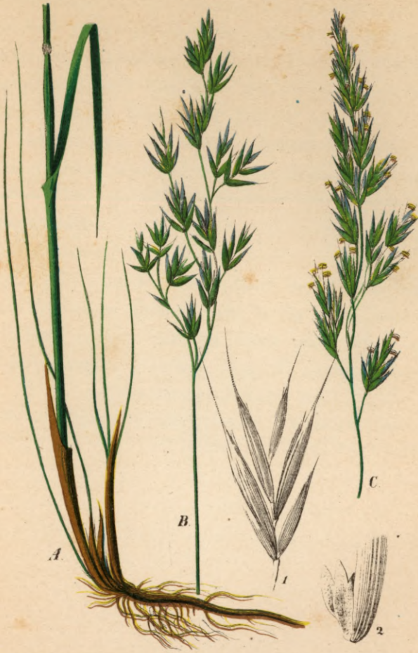
732. Festuca rubra L.