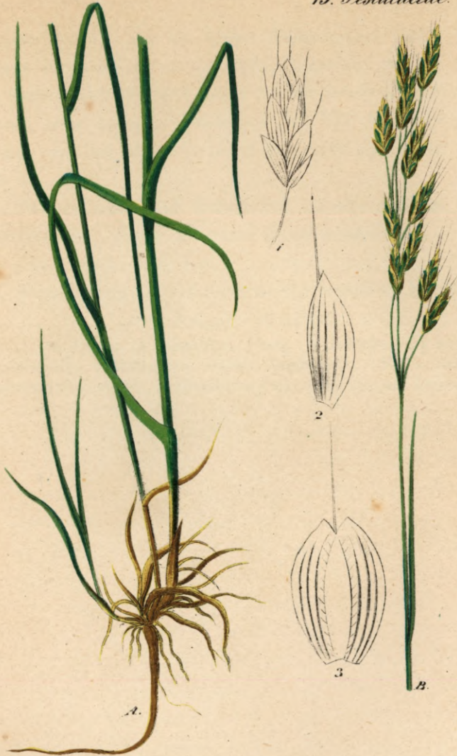
152. Bromus racemosus L.