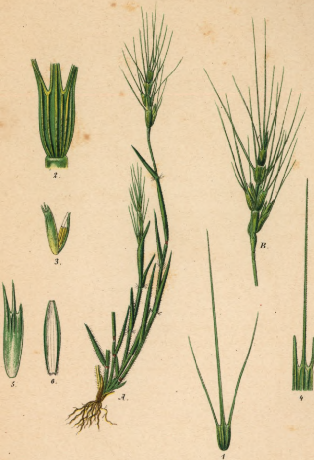
800. Aegilops triuncialis L.