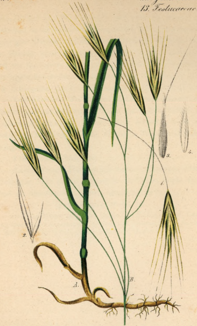
761. Bromus sterilis L.