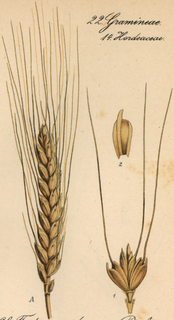
168. Triticum durum Desf. Bartweizen.