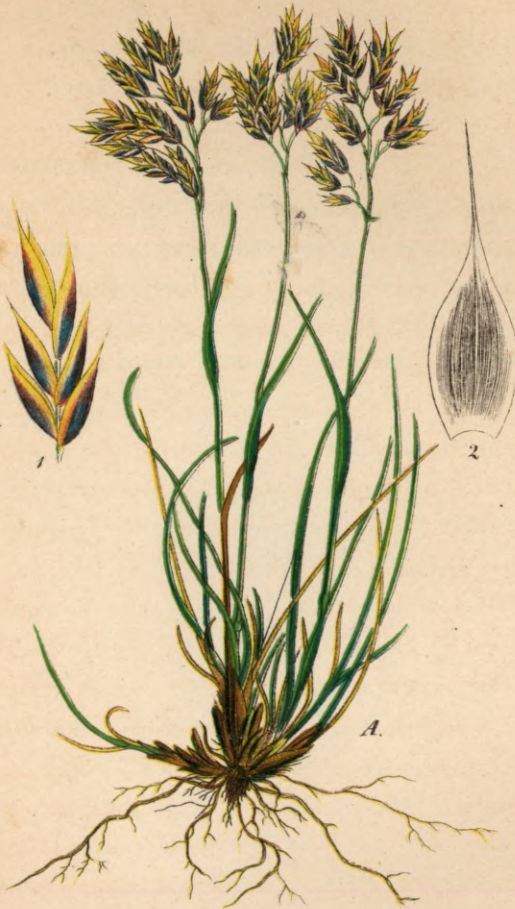
134. Festuca pumila Vill.