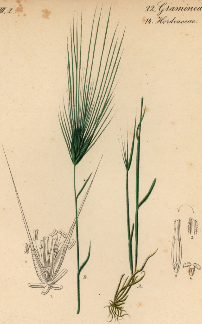
786. Elymus crinitus Schreber.