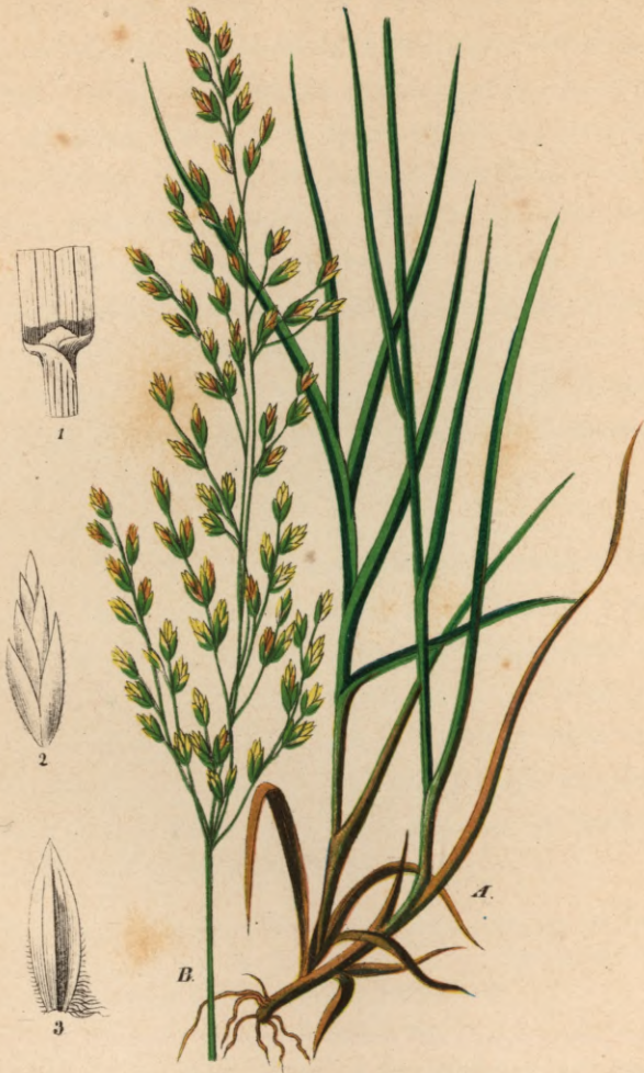
701. Poa fertilis Host.