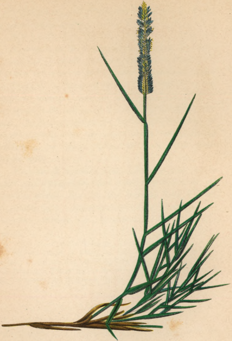
119. Dactylis littoralis W.