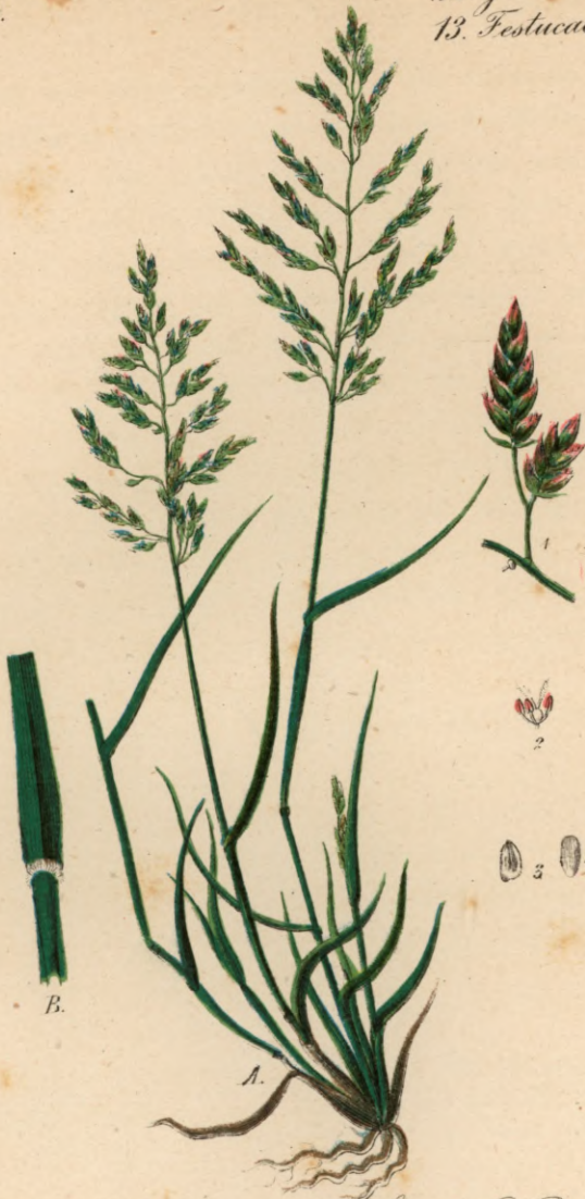
689. Eragrostis pilosa P. B. Haariges Viebesgras.