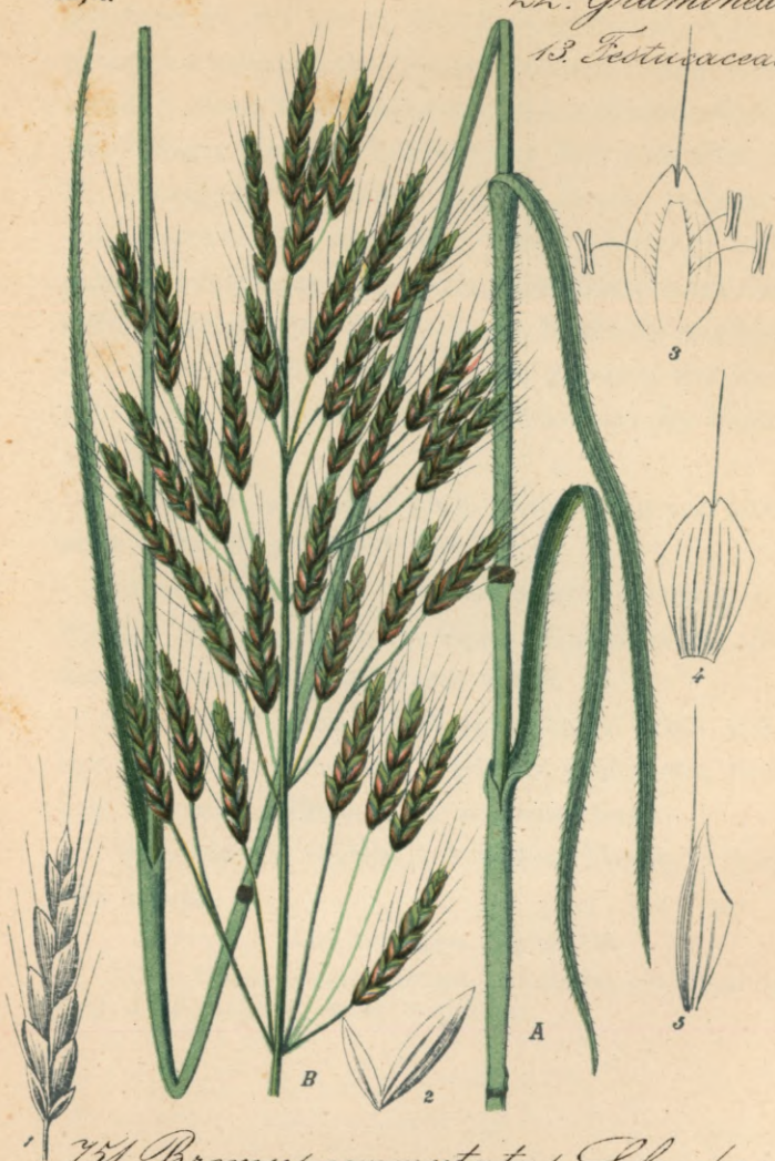
751. Bromus commutatus Schrader. Triften-Trespe.