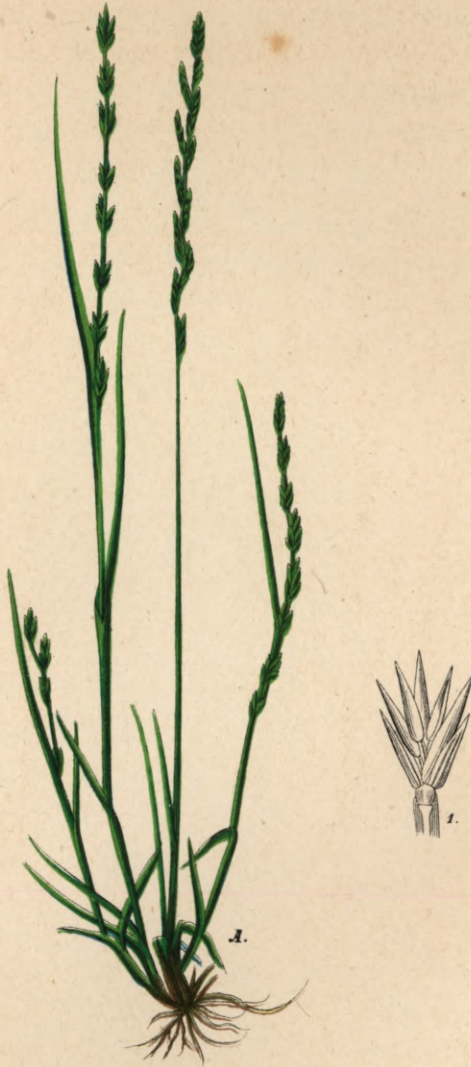
723. Festuca Lachenalii Spennet.