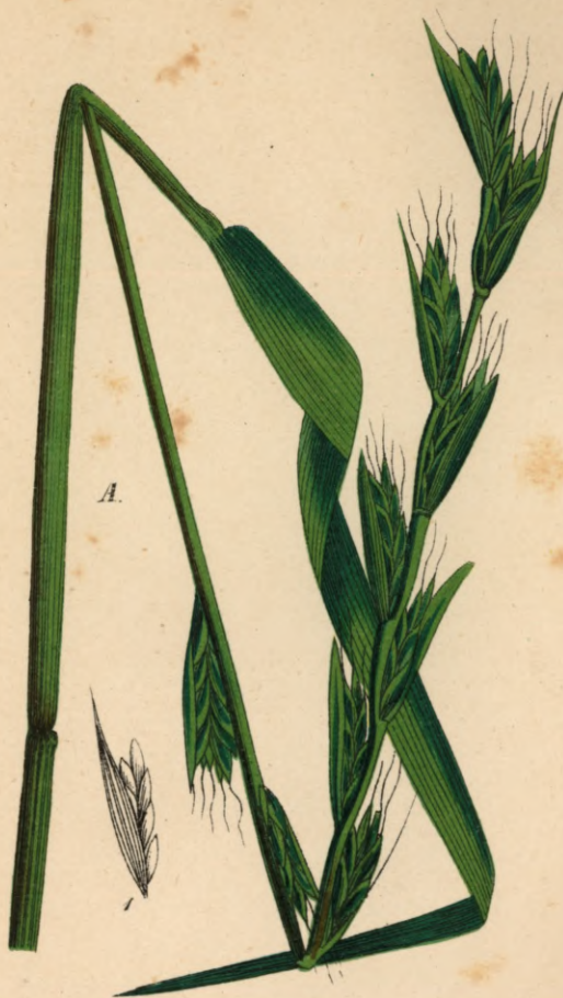
800, II. Lolium temulentum \beta speciosum Koch.