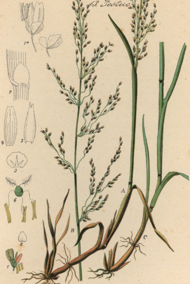
44. Glyceria aquatica Presl. Schmielen-Süßgras.