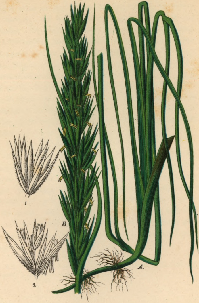
784. Elymus arenarius L.