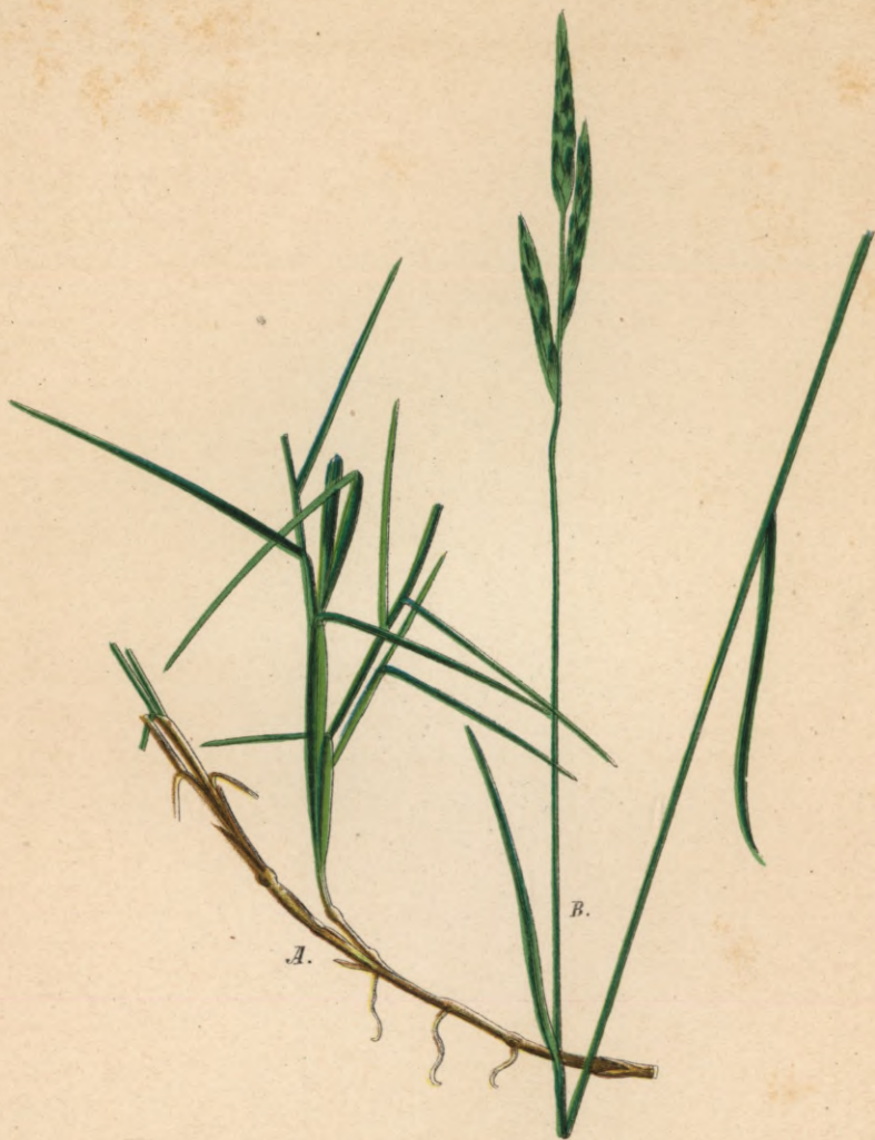
748. Brachypodium ramosum