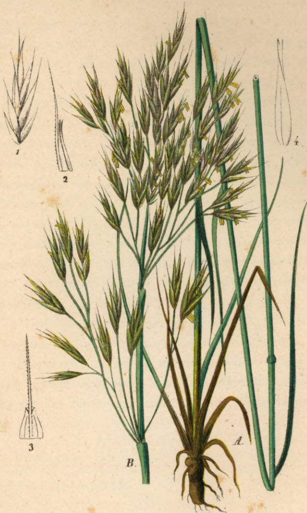
759. Bromus erectus Hudson.