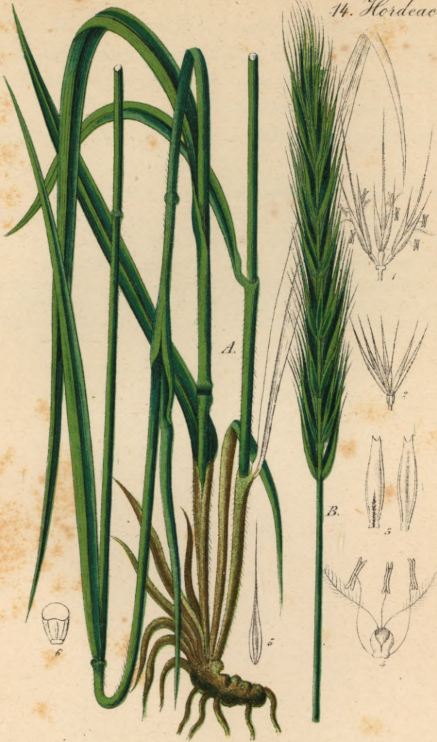
185. Elymus europaeus L.