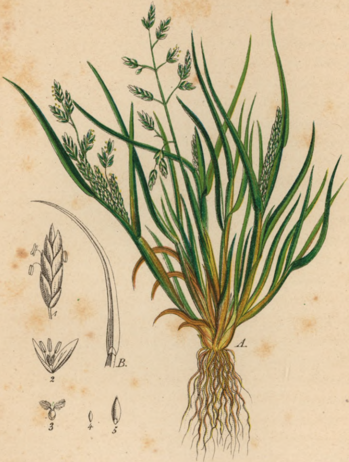
692. Poa annua L.