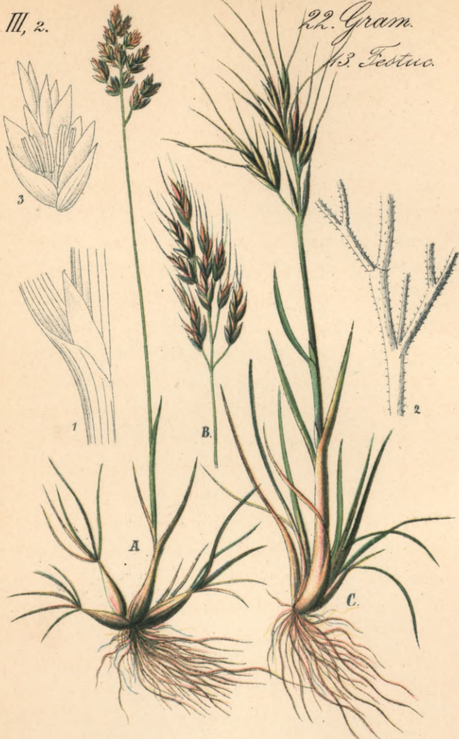
Poa bulbosa L. Knolliges - Rispengras.