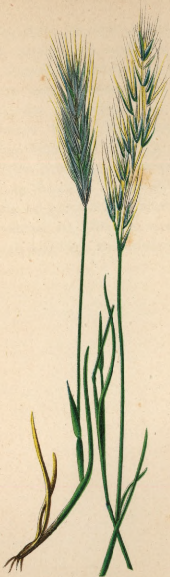
725. Festuca uniglumis Solander.