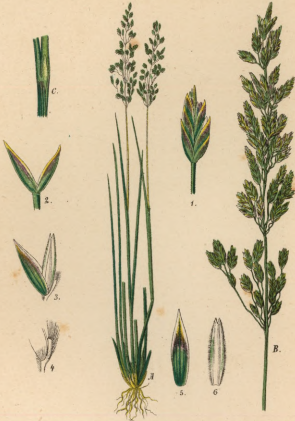
137. Festuca pilosa Haller.