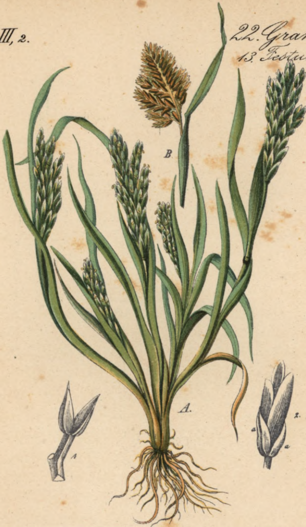
691. Poa dura Scopol. Hartgras.