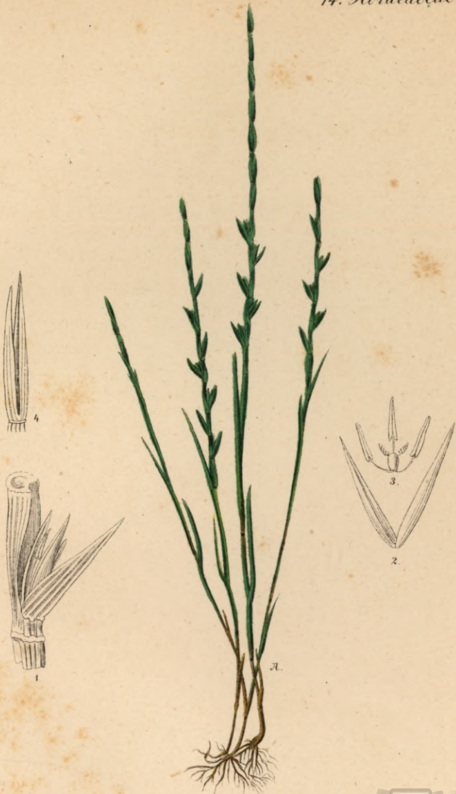
806. Lepturus cylindricus Trin.