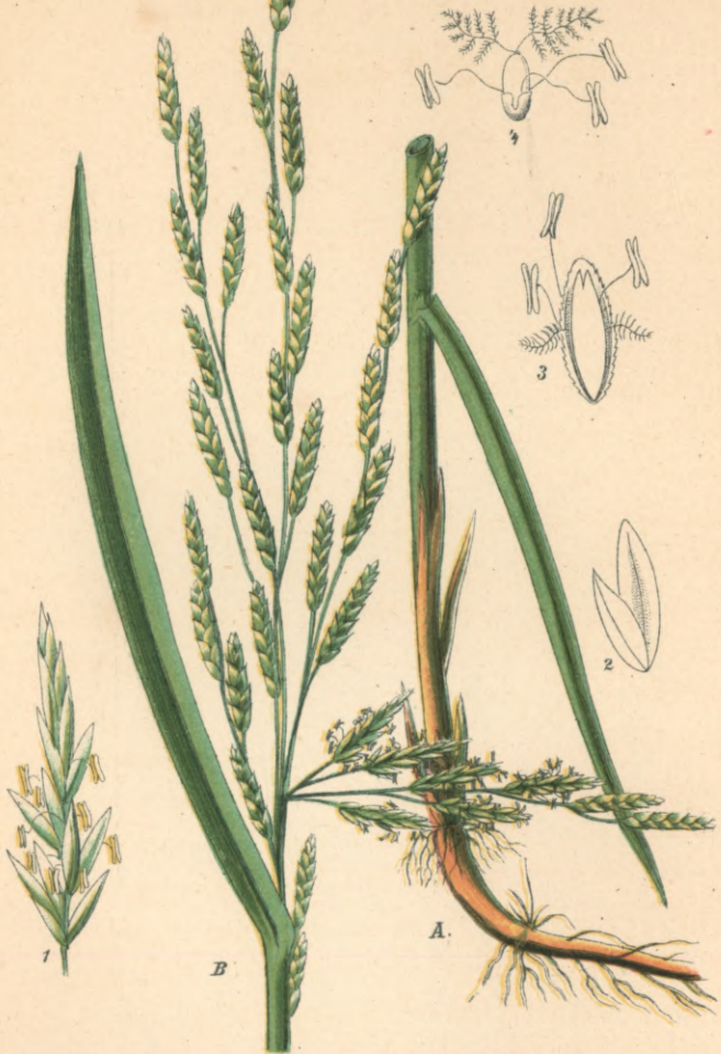
Glyceria fluitans R. Br. Schwadengras.