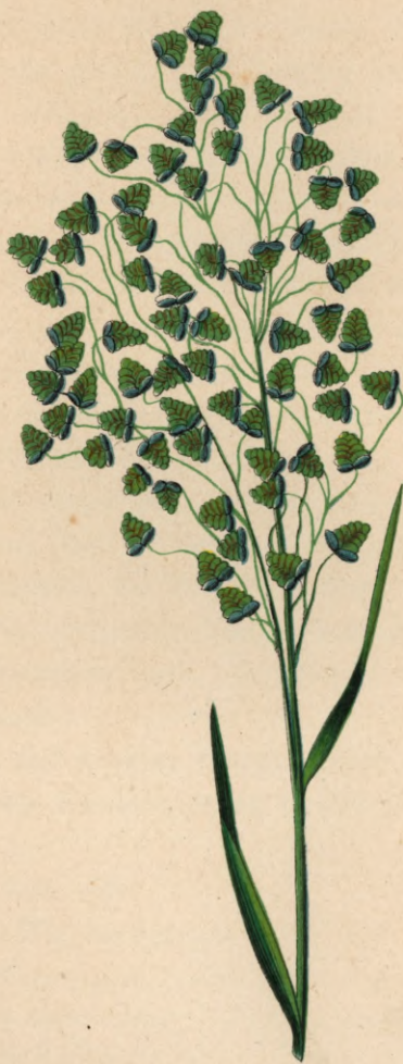
686. Briza minor L. Kleines Bittergras.