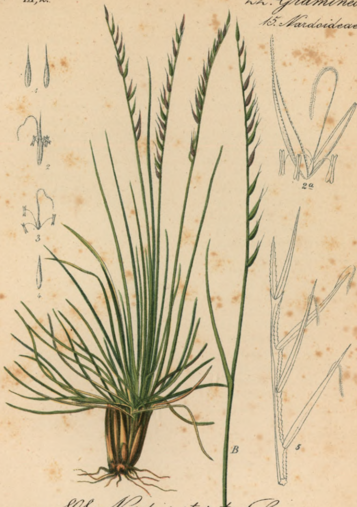
808. Nardus stricta L. Borstengras