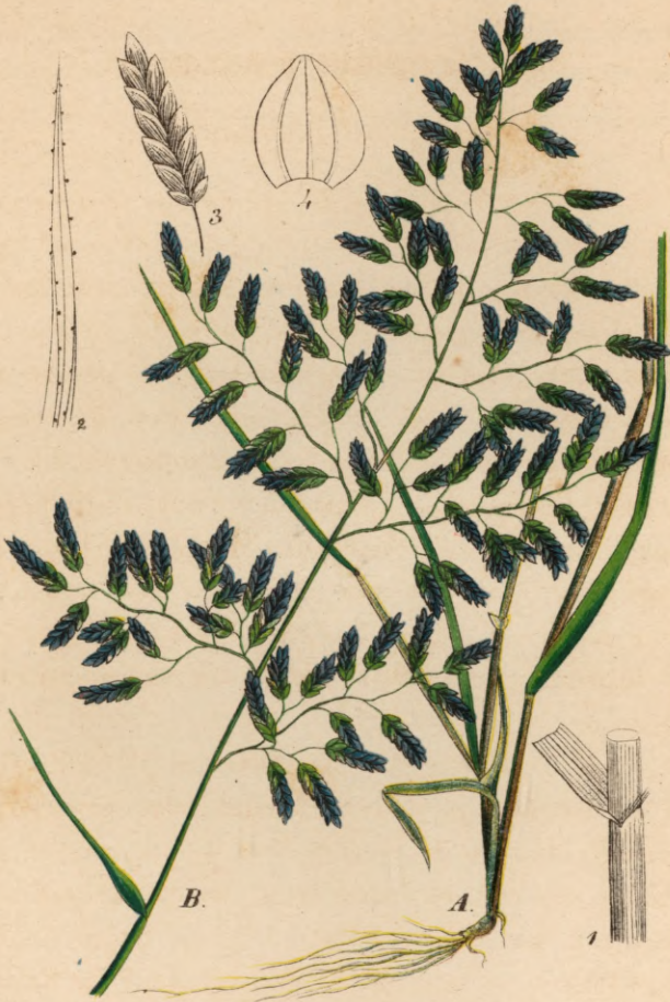
688. Eragrostis poaeoides P. B. Rispiges Liebesgras.