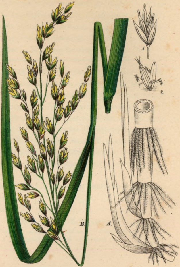
742. Festuca borealis M. K.