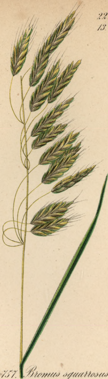
757. Bromus squarrosus L.