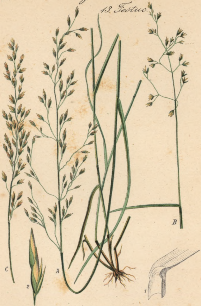
Poa nemoralis L.