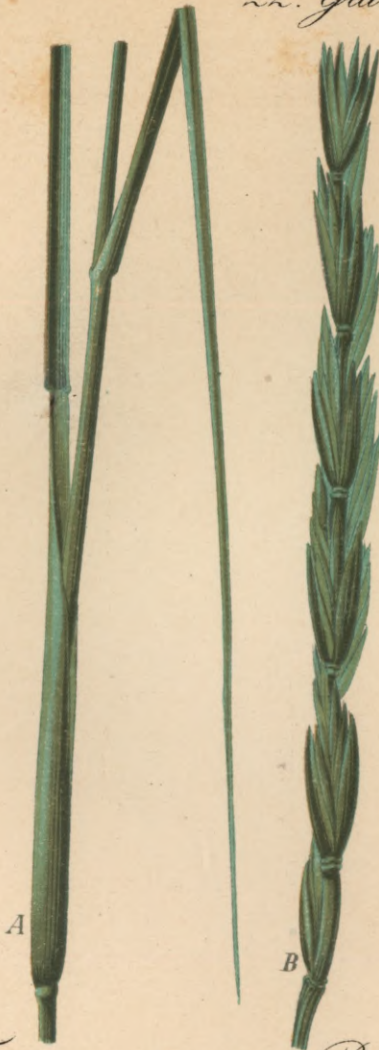
115. Triticum strictum Petharding. Steife Quecke.