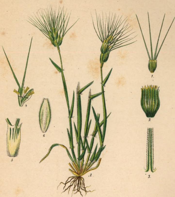
498. Aegilops ovata L.