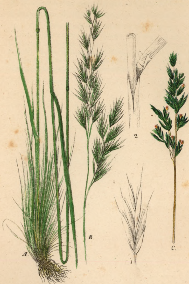
731. Festuca heterophylla Lam.