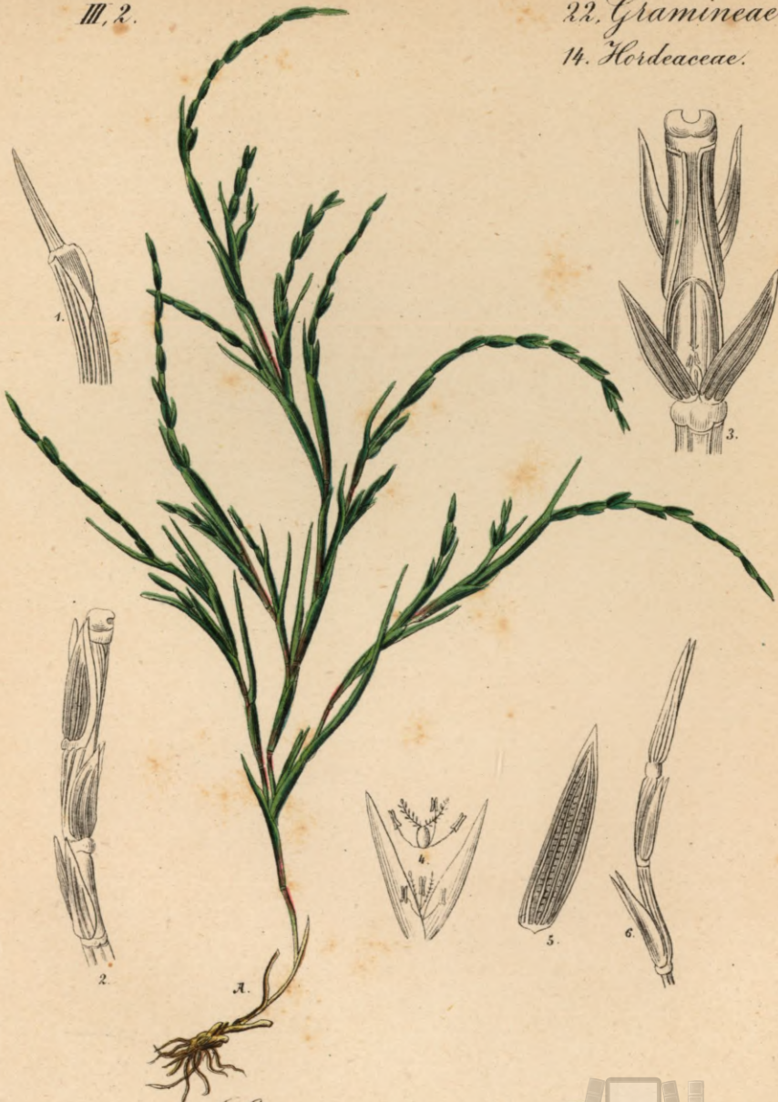
804. Lepturus incurvatus Trin.