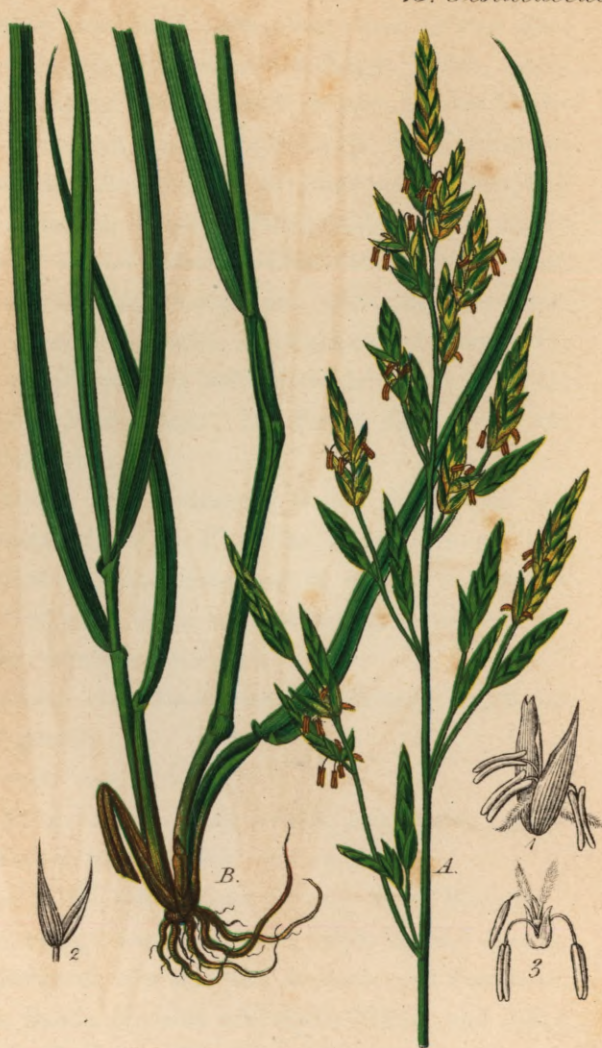
745 1 Festuca elatior L.