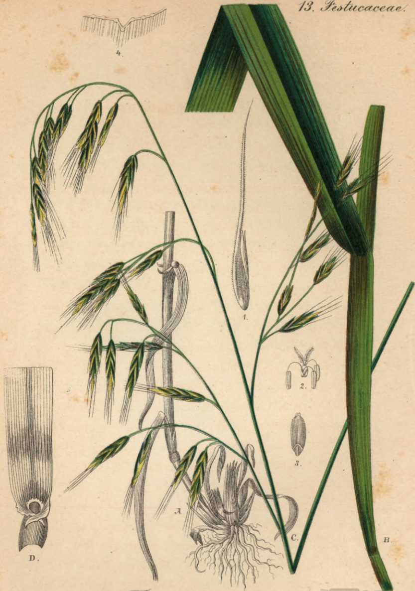
743. Festuca gigantea Vill.