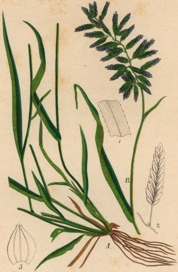
687. Eragrostis megastachya Link.