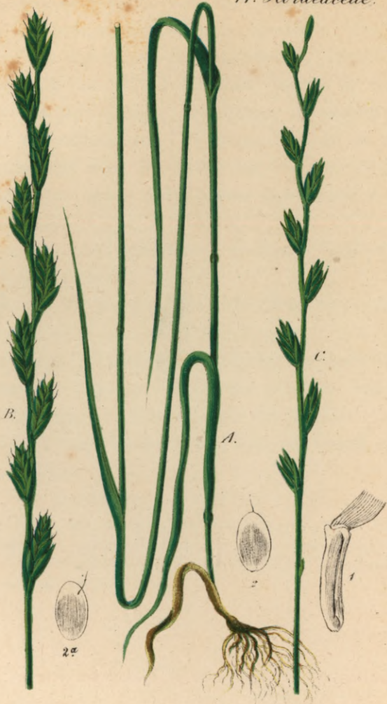
799. Lolium arvense Schrader.