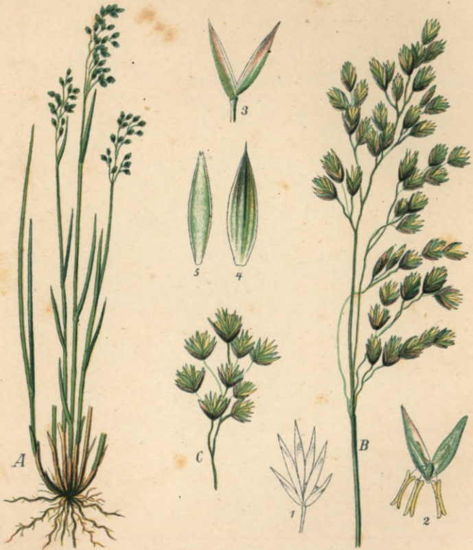
44. Festuca Scheuchzeri Gaud. Scheuchzer's - Schwingel.