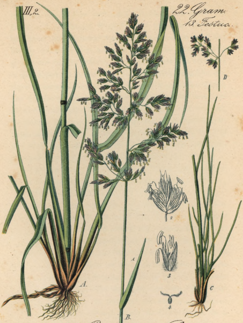
705. Poa pratensis L. Wiesen-Rispengras.