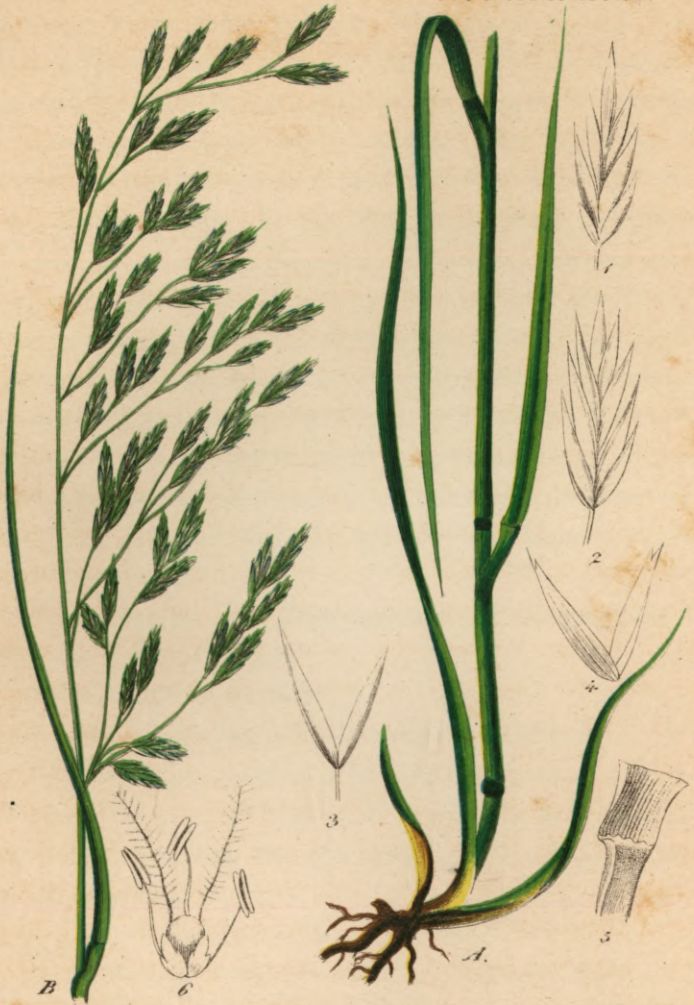
744. Festuca arundinacea Schreber.