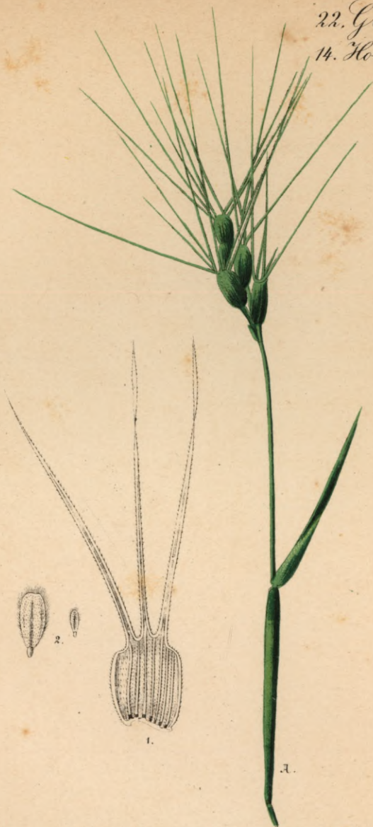
803. Aegilops triaristata W. Dreigranniger Walch.