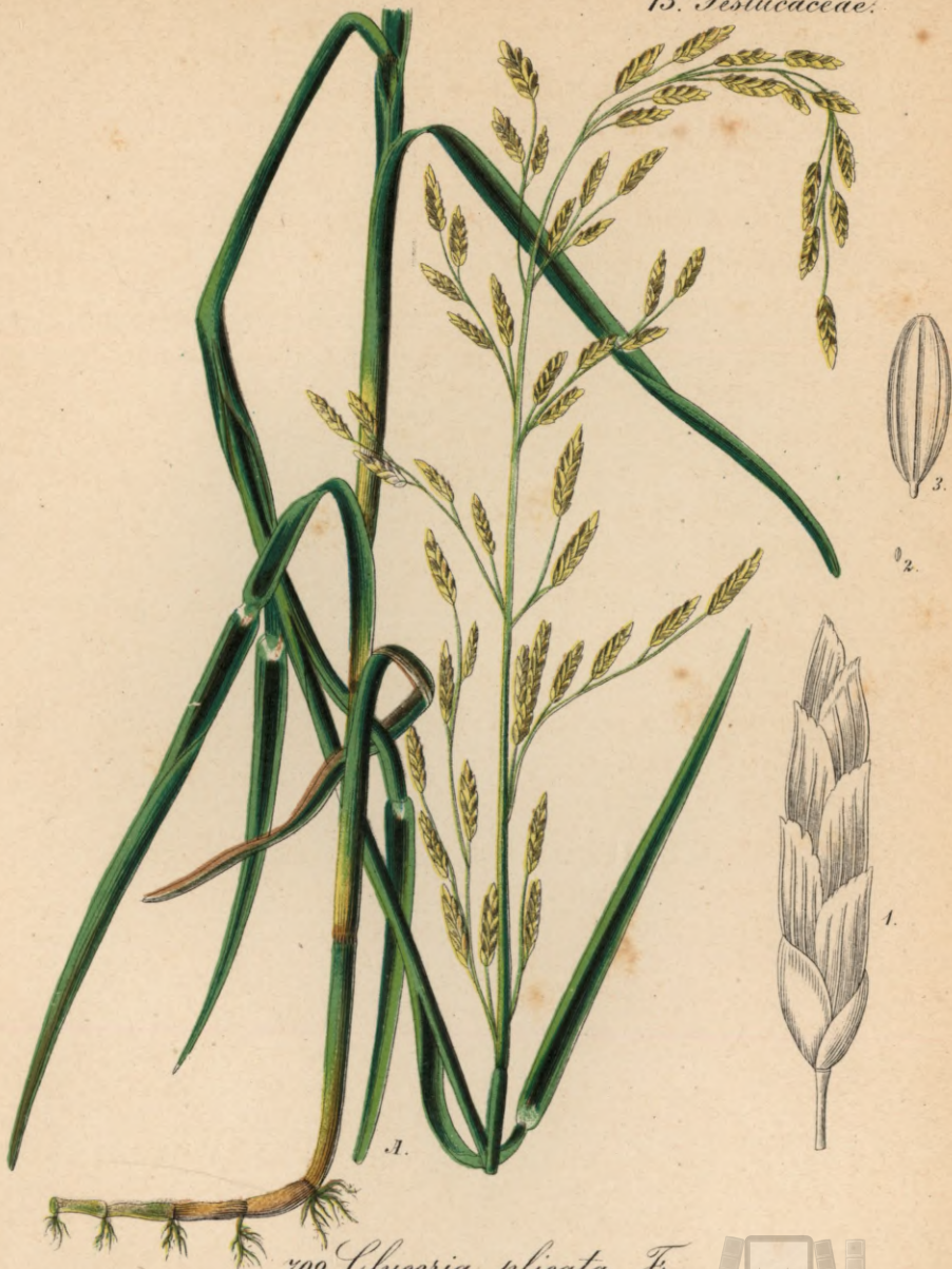
709. Glyceria plicata Fr.