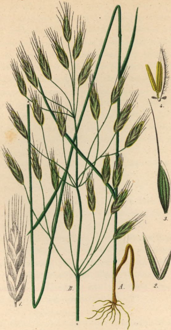
755. Bromus arvensis L.