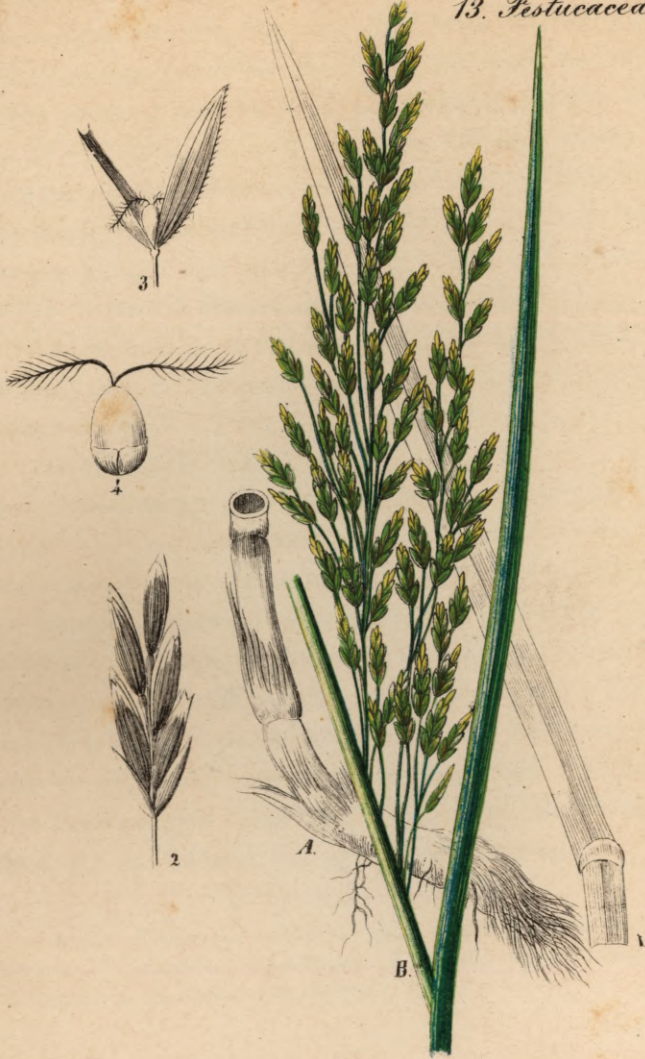
708. Glyceria spectabilis M.K. Viehgras.