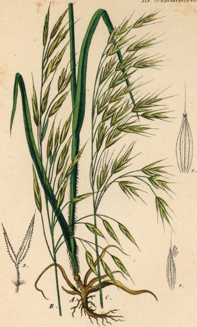
758. Bromus asper Murray.