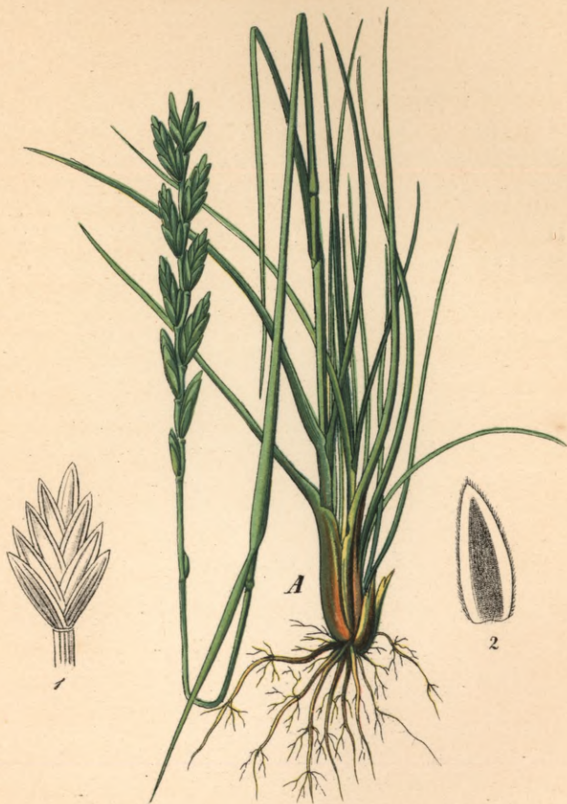
116. Triticum acutum DC. Spitze Quecke.