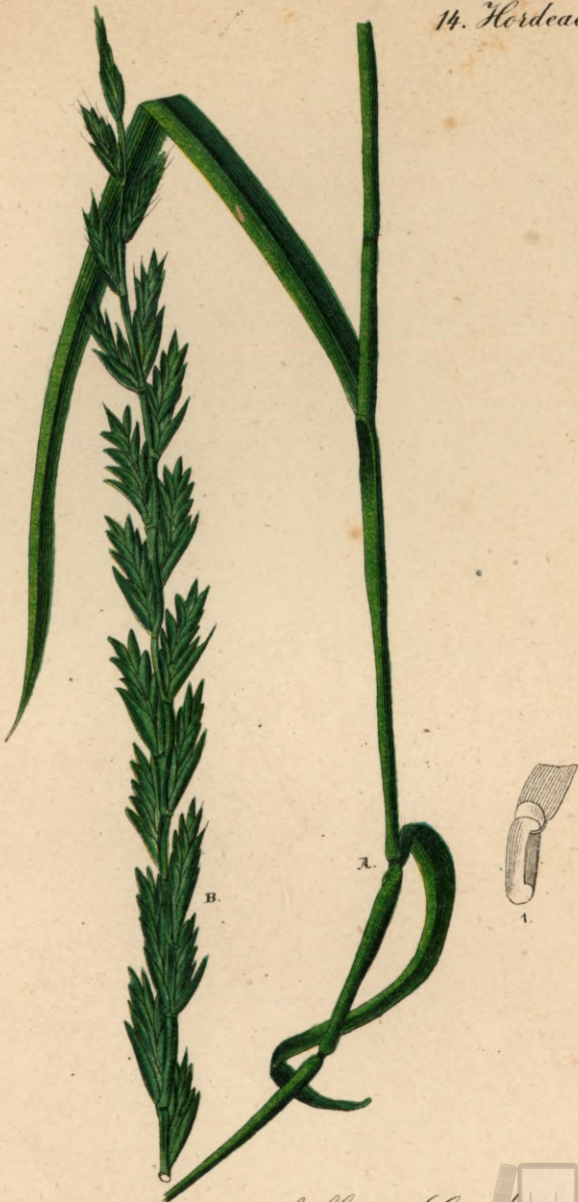
797. Lolium multiflorum Gaudin.