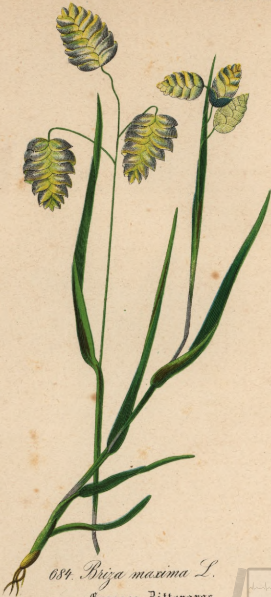
684. Briza maxima L. Grosses Billergras.