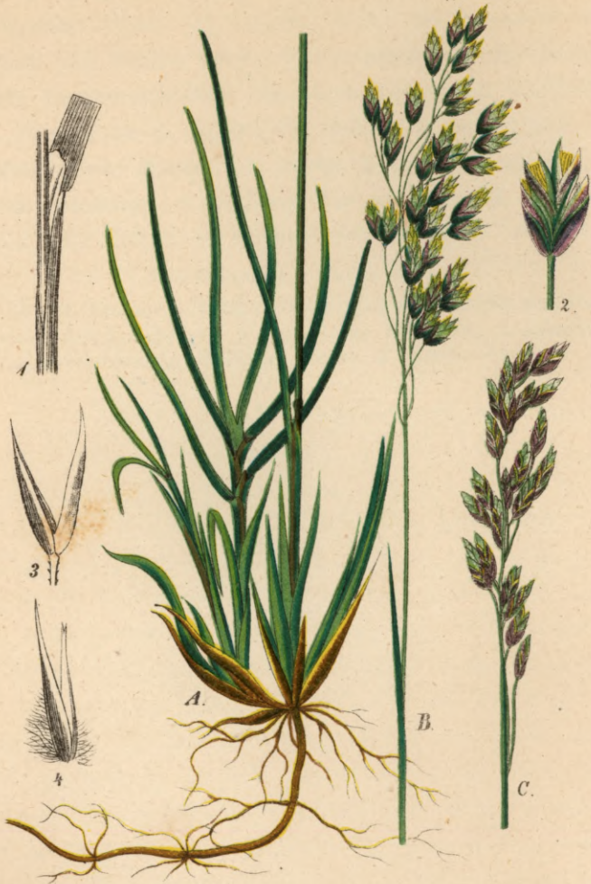
706. Poa cenisia All.