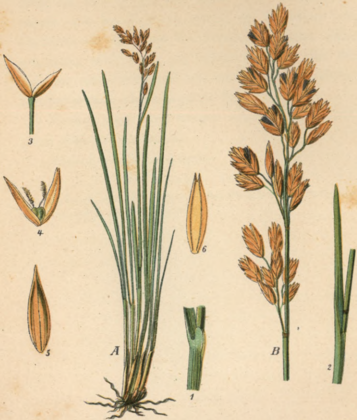
235. Festuca spadicea L.