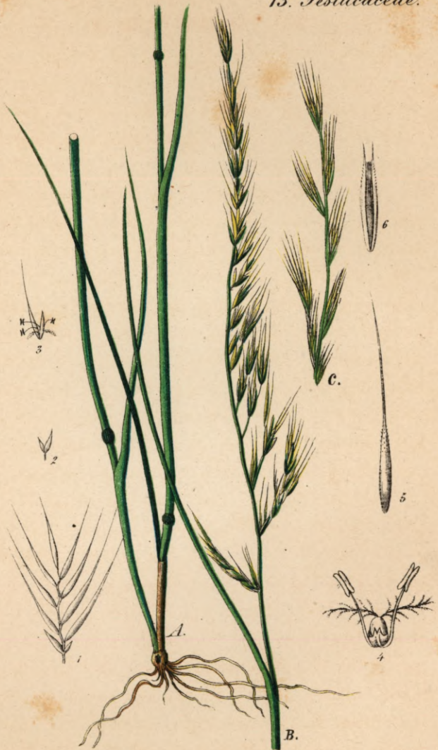
727. Festuca myurus Koch.