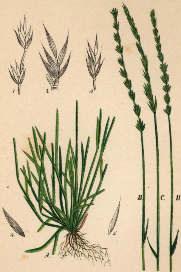
122. Festuca tenuiflora Schrader.