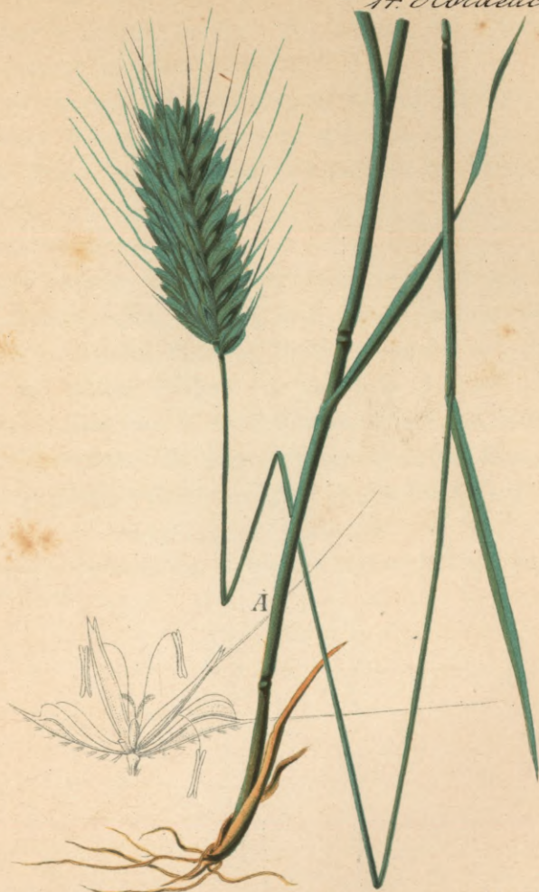
223. Triticum villosum M. B. Bottiger Weizen.