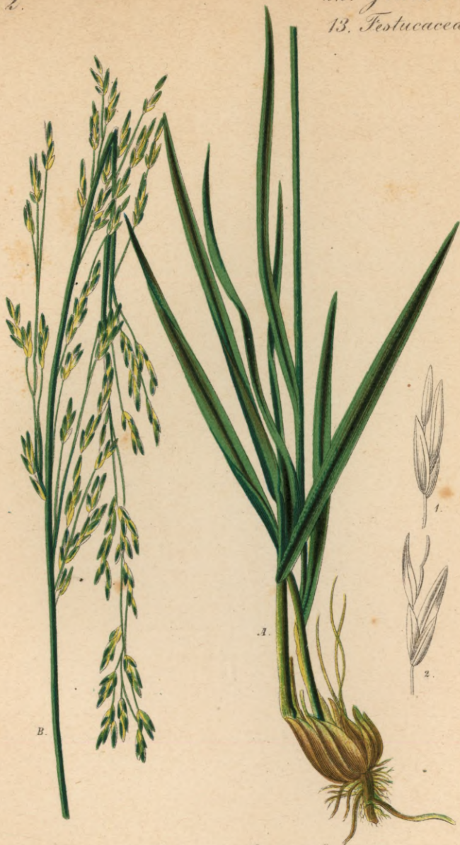
716. Molinia littoralis Host.