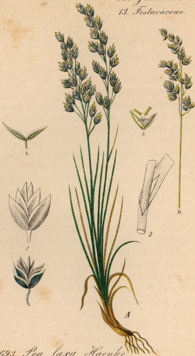
693. Poa laxa Haenke.