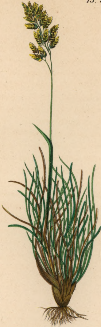
696. Poa concinna Gaud Gedrungenes Rispengras.