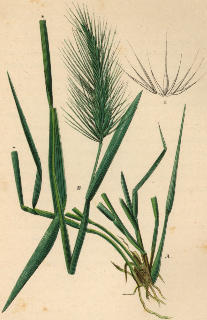
794. Hordeum maritimum With.