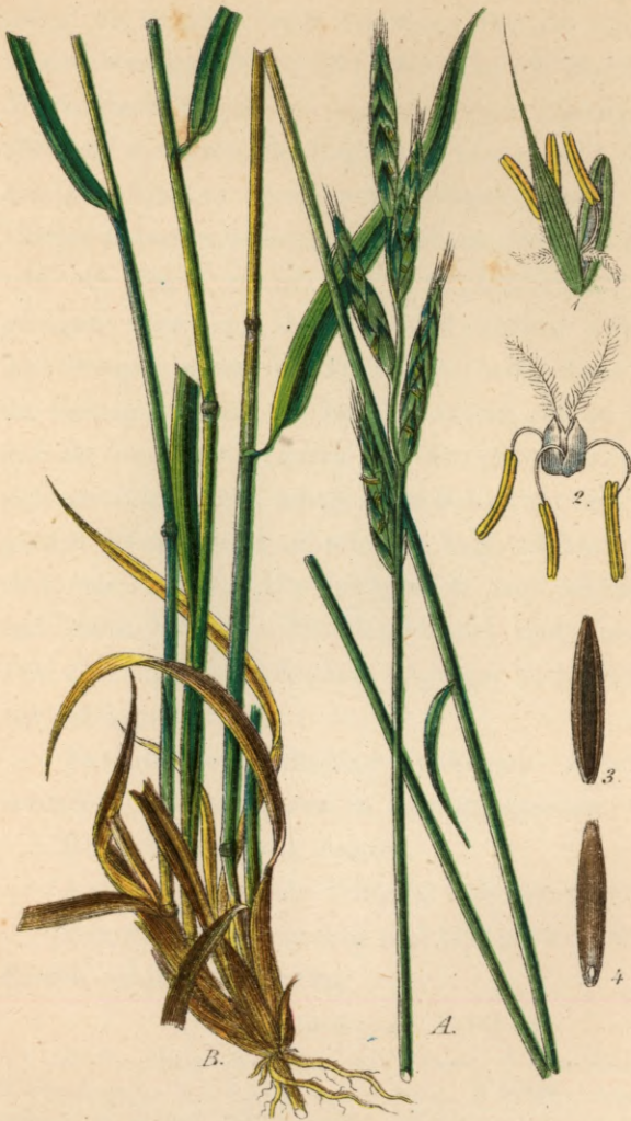
147. Brachypodium pinnatum P.B. Held-Bwenke.