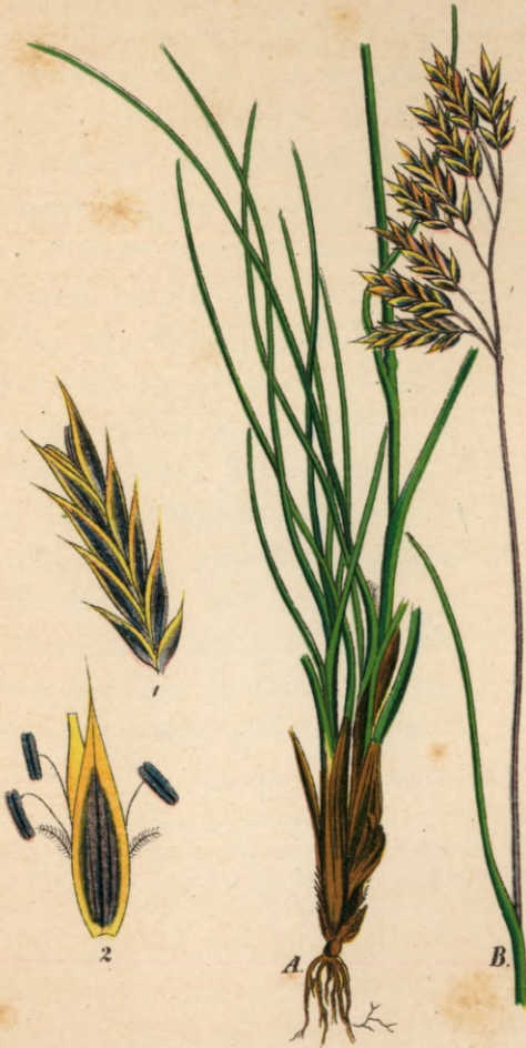
133. Festuca varia Haenke.