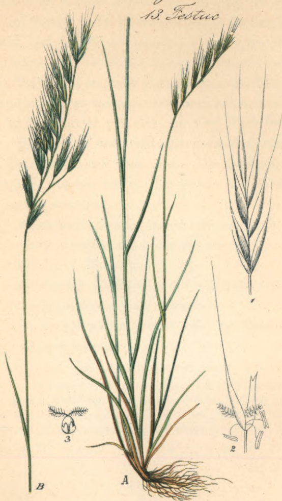
22. Festuca bromoides Koch. Crespen - Schwingel.