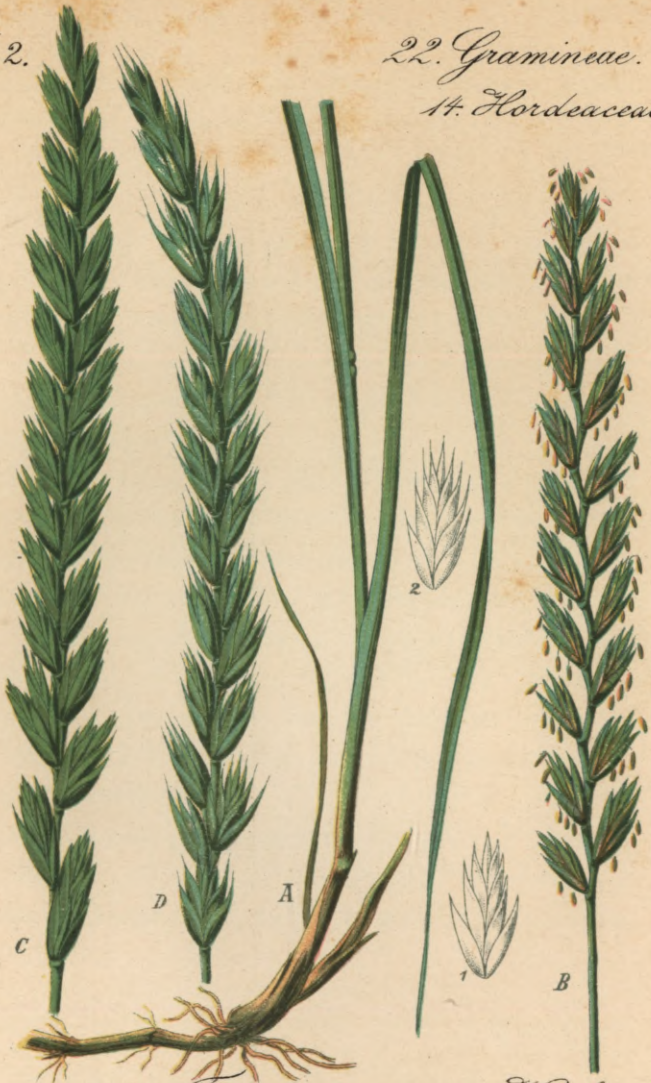
719. Triticum repens Koch. Gemeine Quecke.