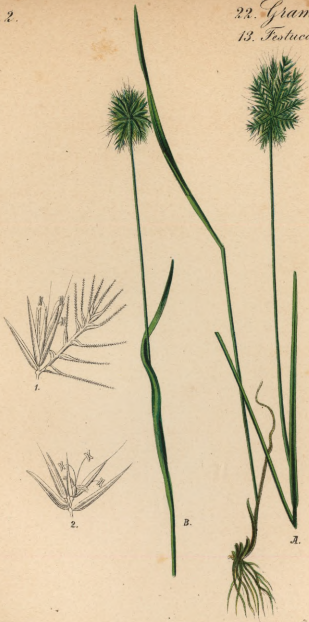
121. Cynosurus echinatus L.