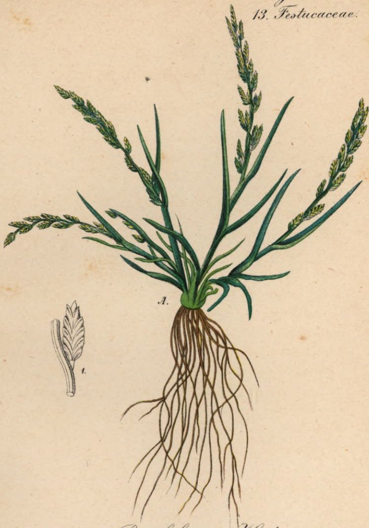
690. Poa loliacea Huds.