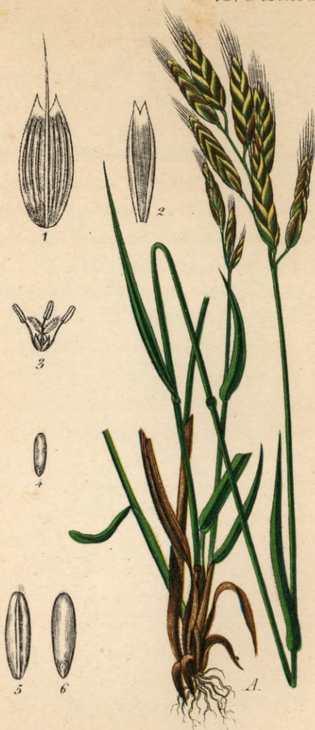
753. Bromus mollis L.