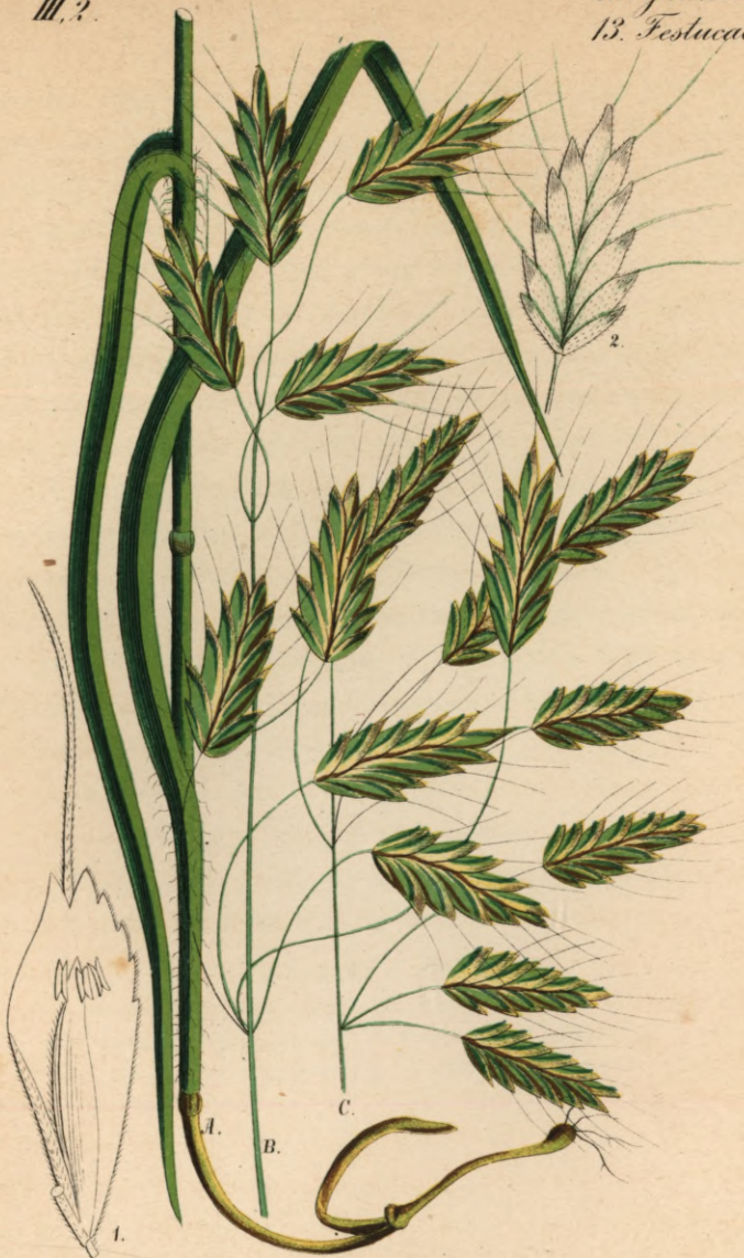
756. Bromus patulus M. K.