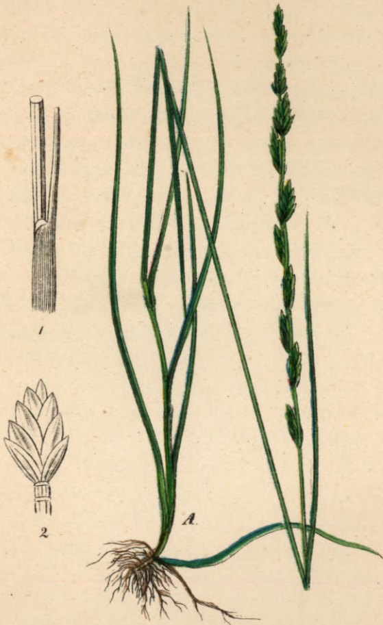
729. Festuca Halleri . Allioni