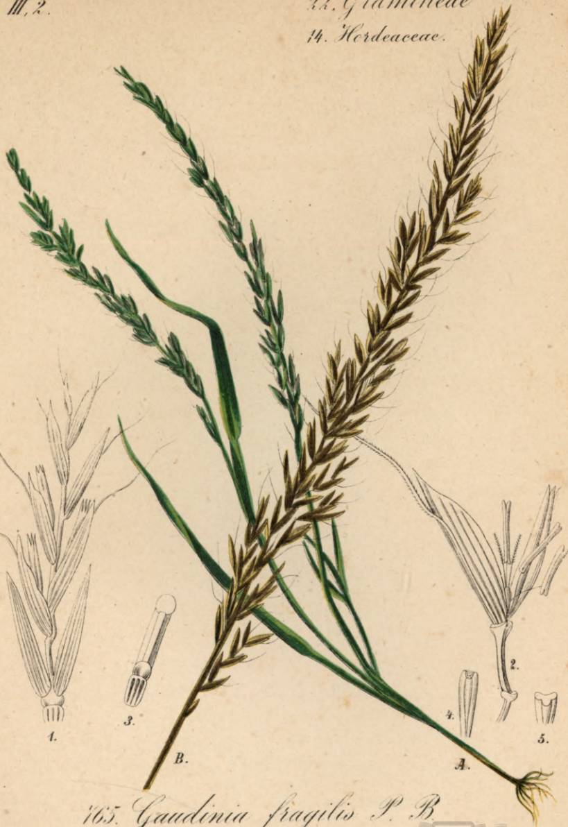
165. Gaudinia fragilis P. B.