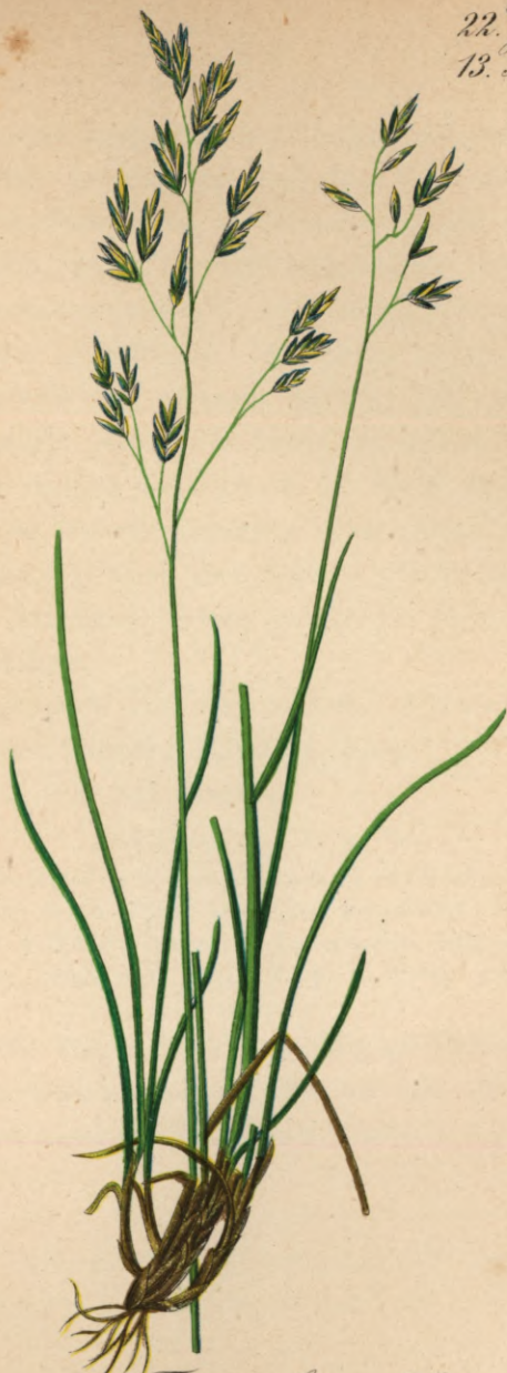
136. Festuca laxa Host.