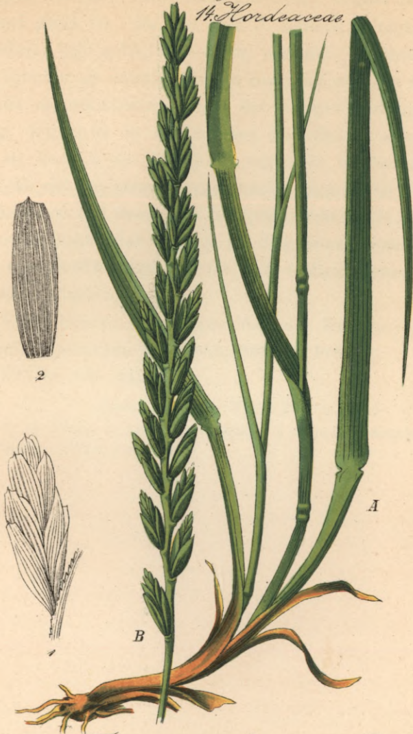
778. Triticum glaucum Desf Graugrüne Quecke.