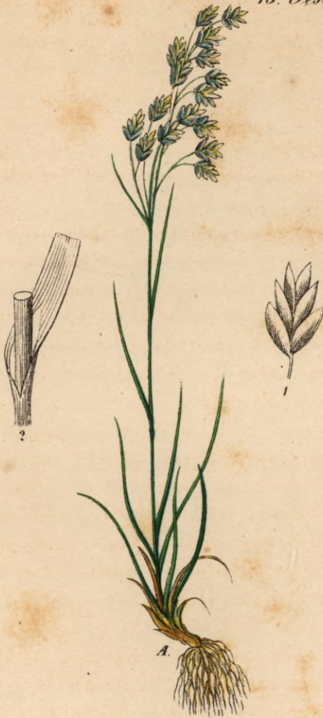
694. Poa minor Gaud.