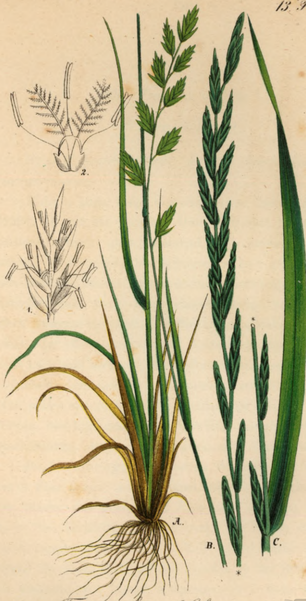
145. II. Festuca elatior - Lolium perenne .