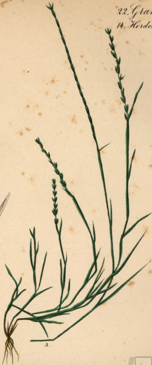
805. Lepturus filiformis Trin.