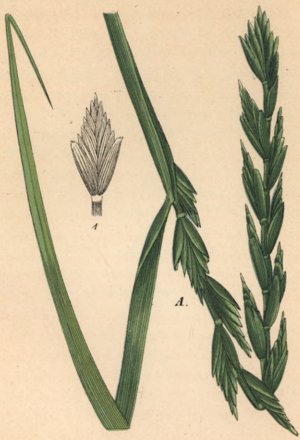
780. Triticum rigidum Schrad. Starre Quecke.