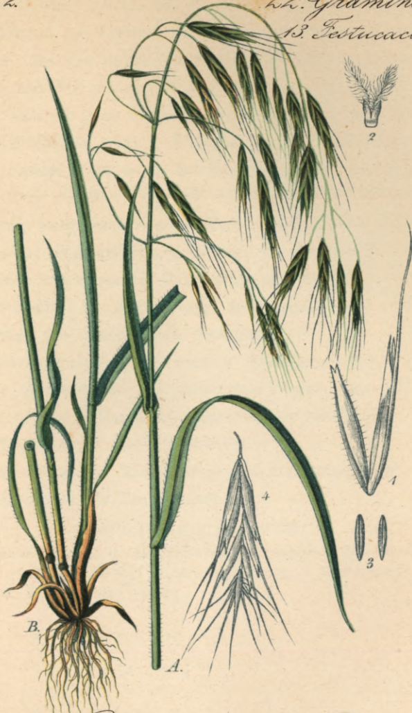
162. Bromus tectorum L. Dach-Trespe.