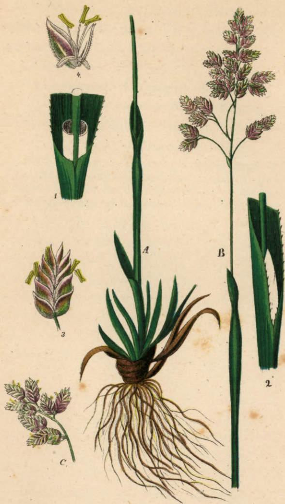
698. Poa alpina L. Alpen-Rispengras.