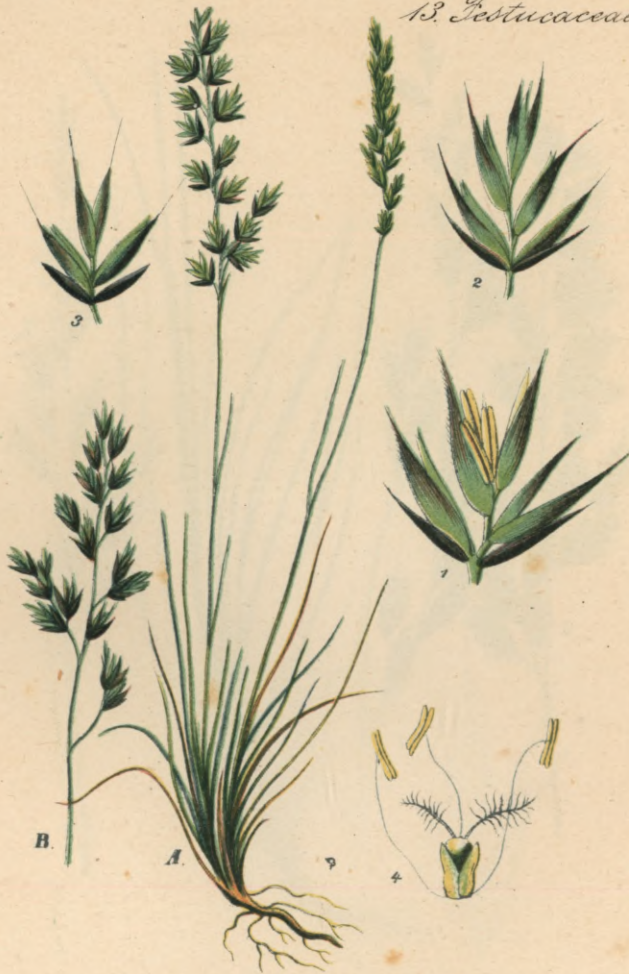
730. I. Festuca ovina L. Schafschwingel.