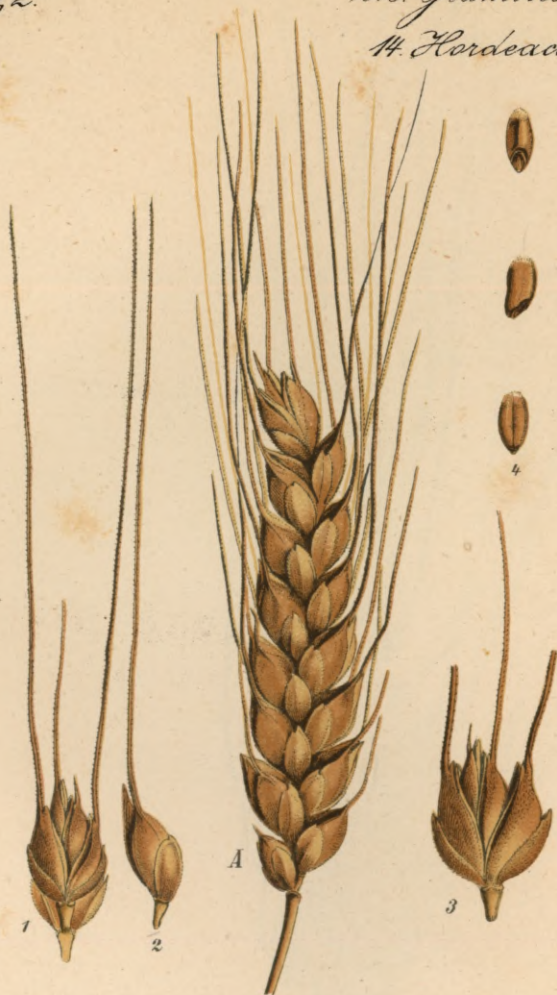
161. Triticum turgidum L. Englischer Weizen.