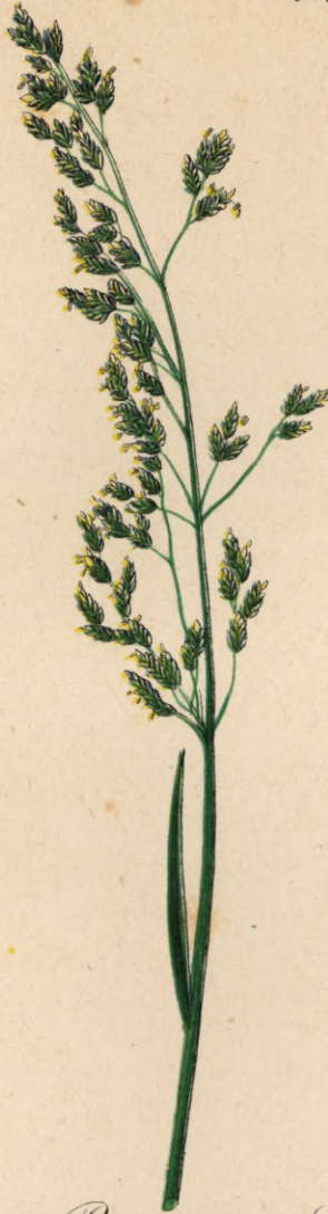
699. Poa caesia Sm.