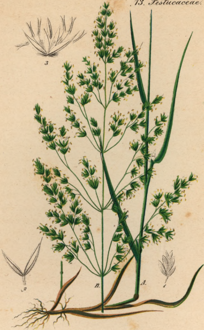
704. Poa trivialis L.