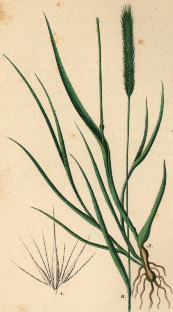
793. Hordeum secalinum Schreber.