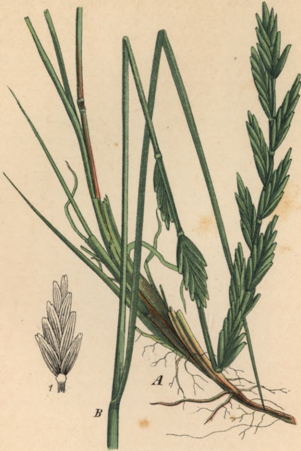
174. Triticum junceum L. Binseartige Quecke.