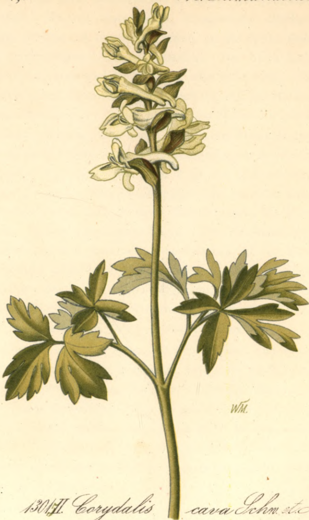
13017. Corydalis cava Schm. et N.