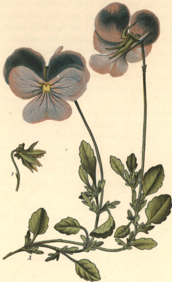
12871 Viola calcarata L.