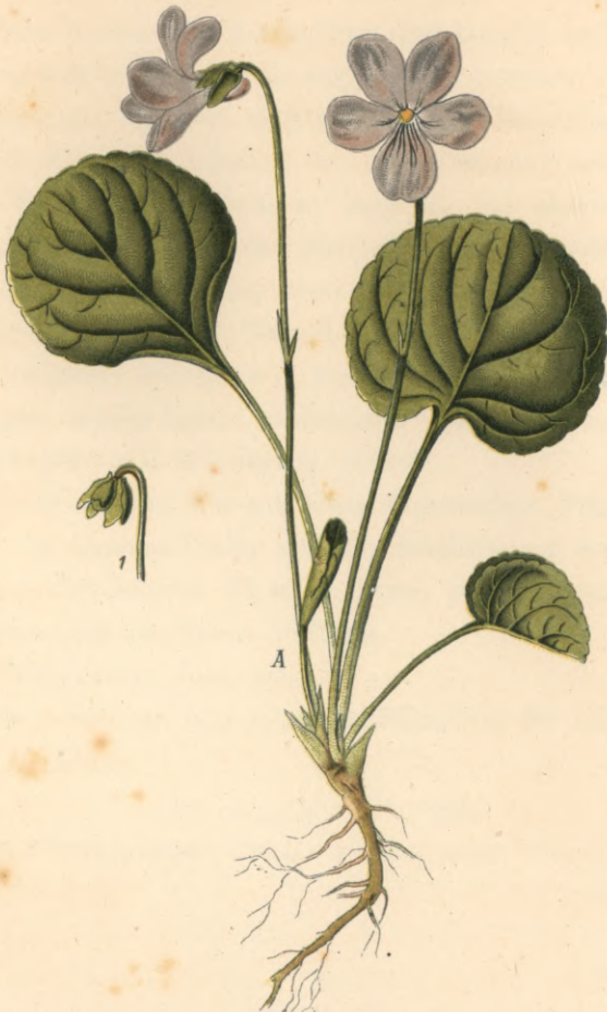
1263. Viola palustris L.