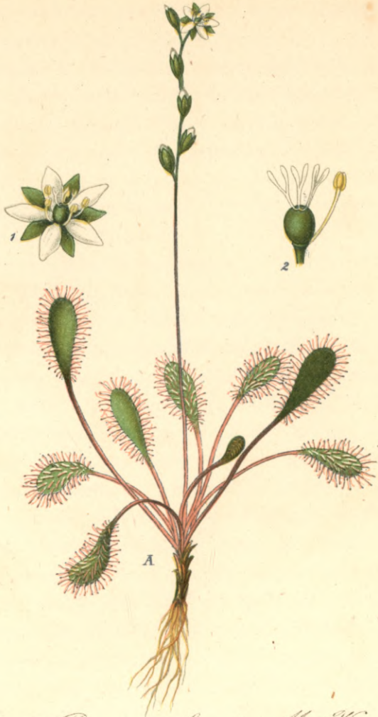
129111. Drosera obovata Mett.