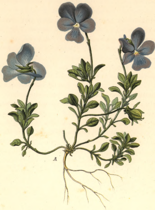
1289. Viola conisia L.