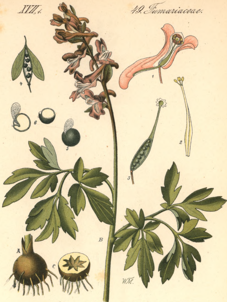
13051. Corydalis cava Schw. et K. Hohlwurz - Taubenkropf.