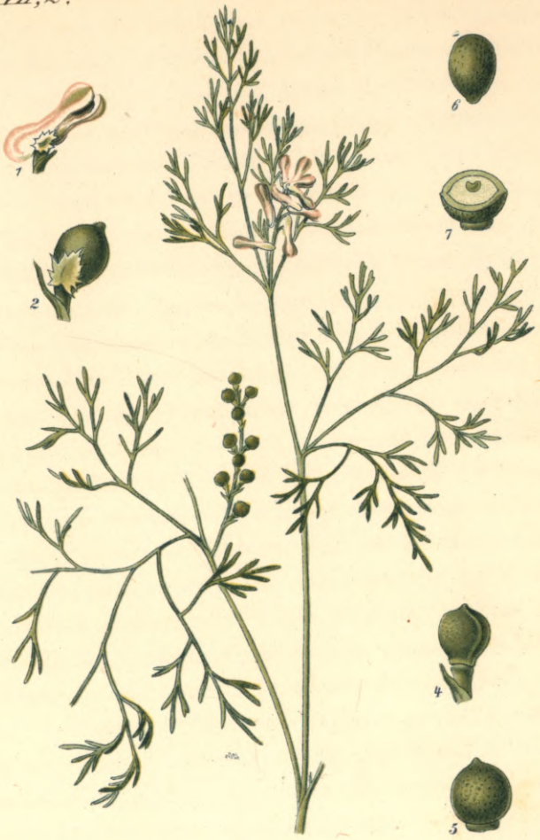
1311. Fumaria parviflora Lamourgue. Kleinblüthiger - Erdrauch.