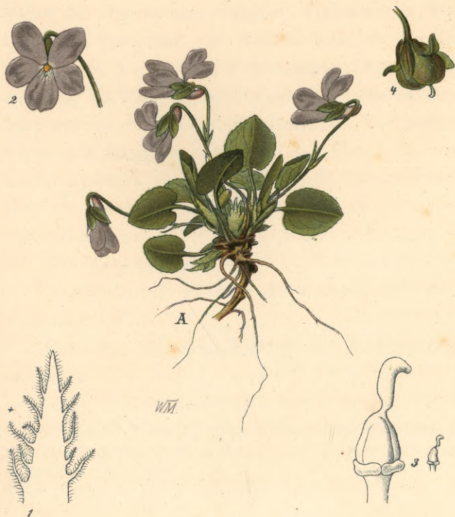
126. Viola collina Buser.