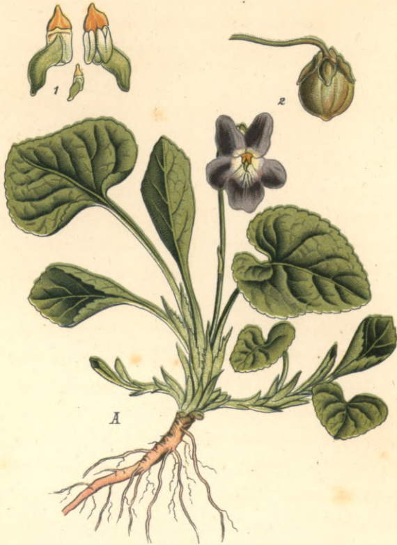
Viola odorata L. III. var. Steveni .