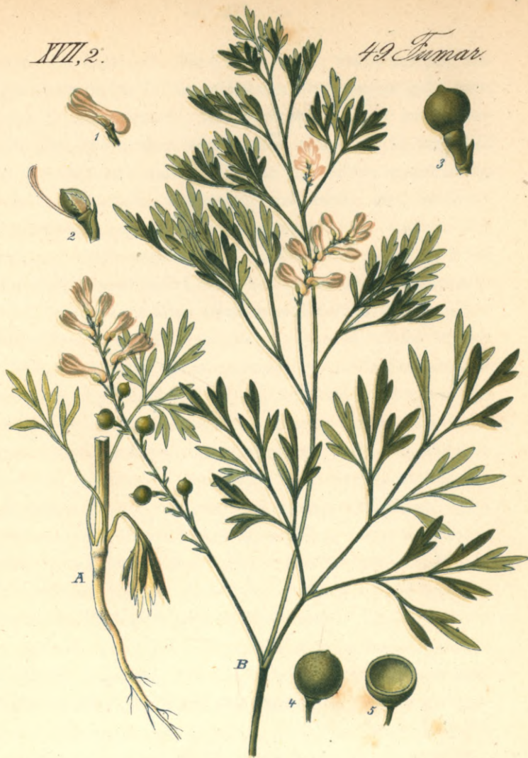
1316. Fumaria Vaillantii Loiseleur.