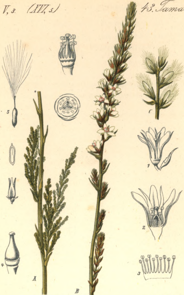
1248. Myricaria germanica Desv. Deutsche-Tamariske.