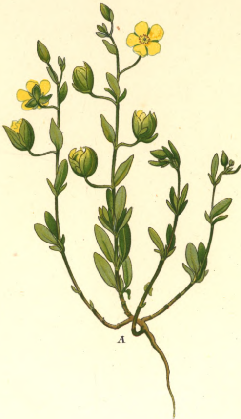
1256. Helianthemum salicifolium Pers. Weidenblättriges-Sonnenröschen.