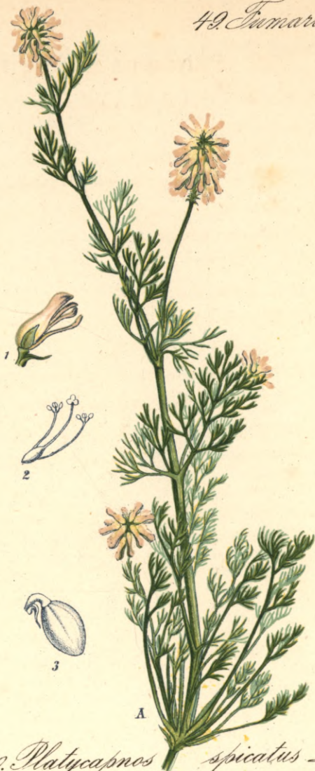
1320. Platycodon spicatus L. Aehriger - Erdrauch.