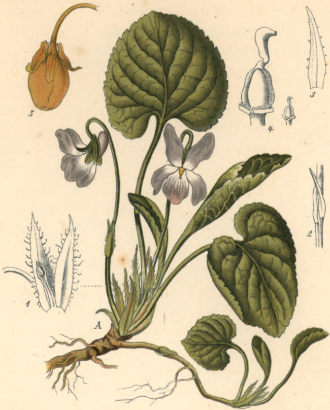
Viola suaveolens M. B.