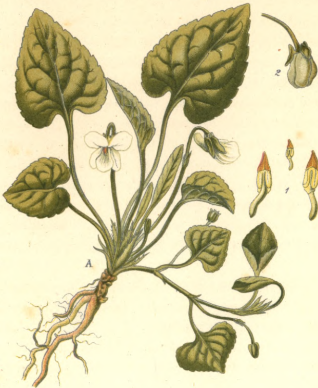
1211. Viola alba Besser.