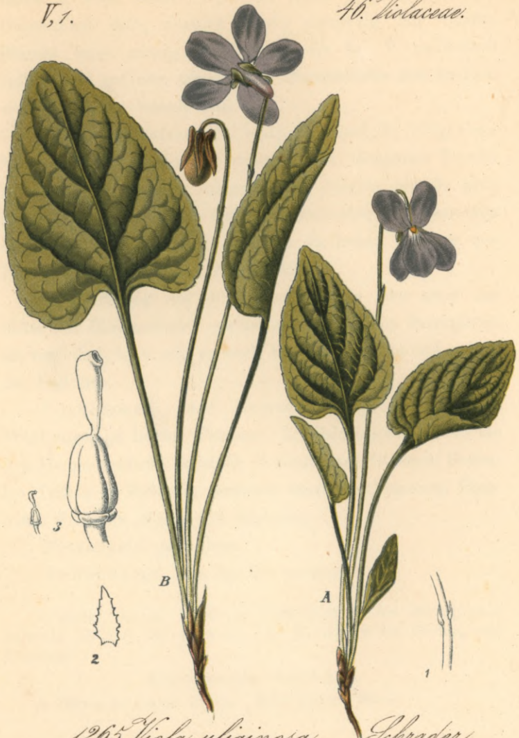
1265. Viola uliginosa Schrader. Moorveilchen.