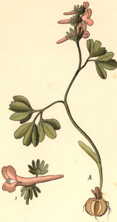
1308. Corydalis pumila Host. Niedriger-Erdrauch.