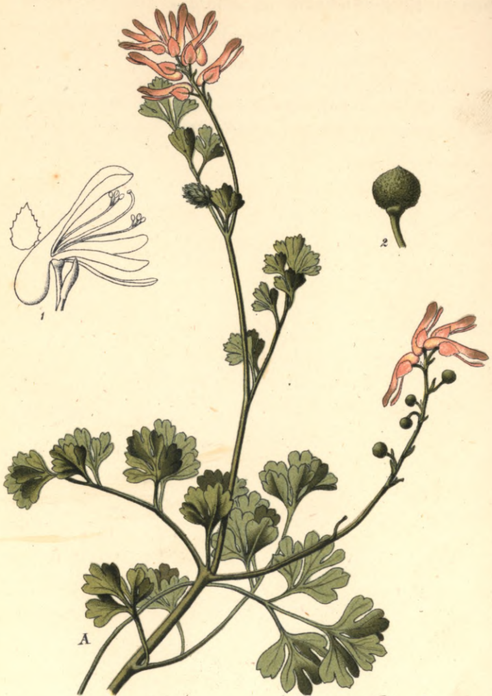
1318. Fumaria agraria Lagasca.