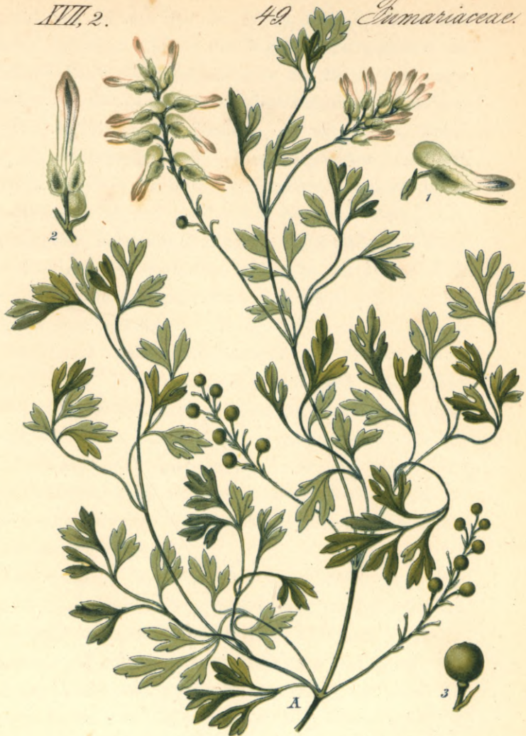
1314. Fumaria capreolata L.