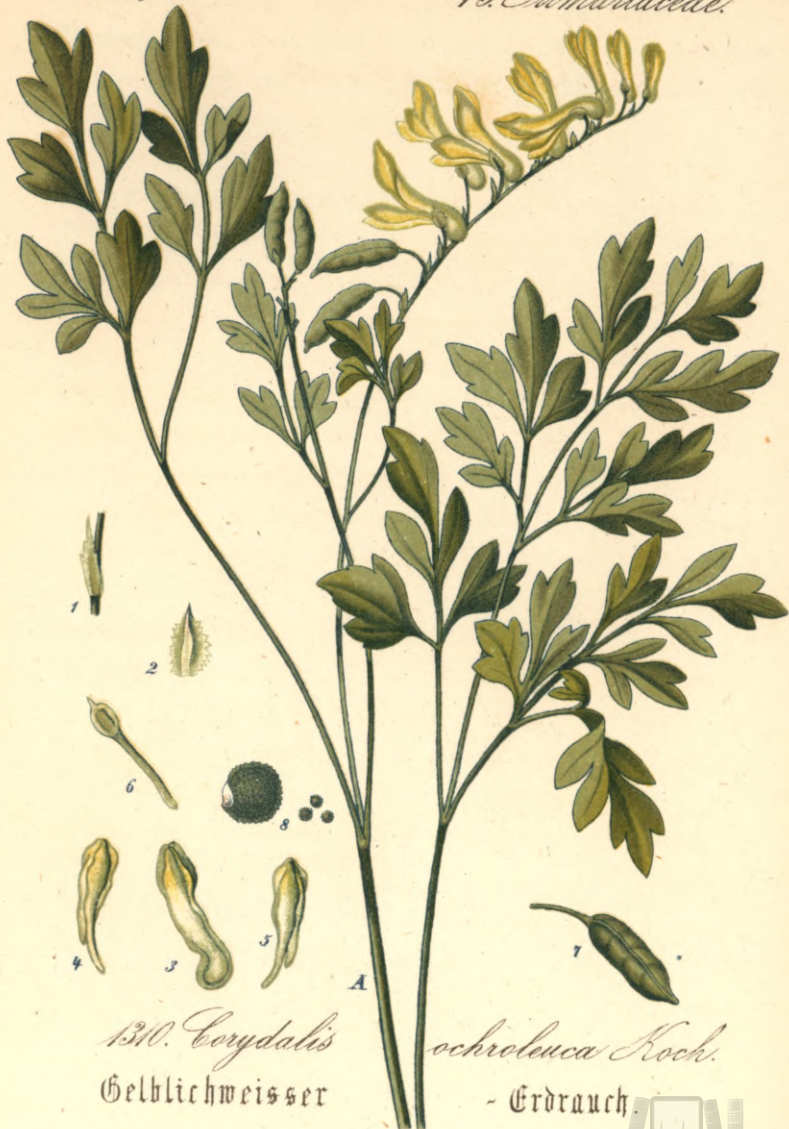
1310. Corydalis Gelblichweisser