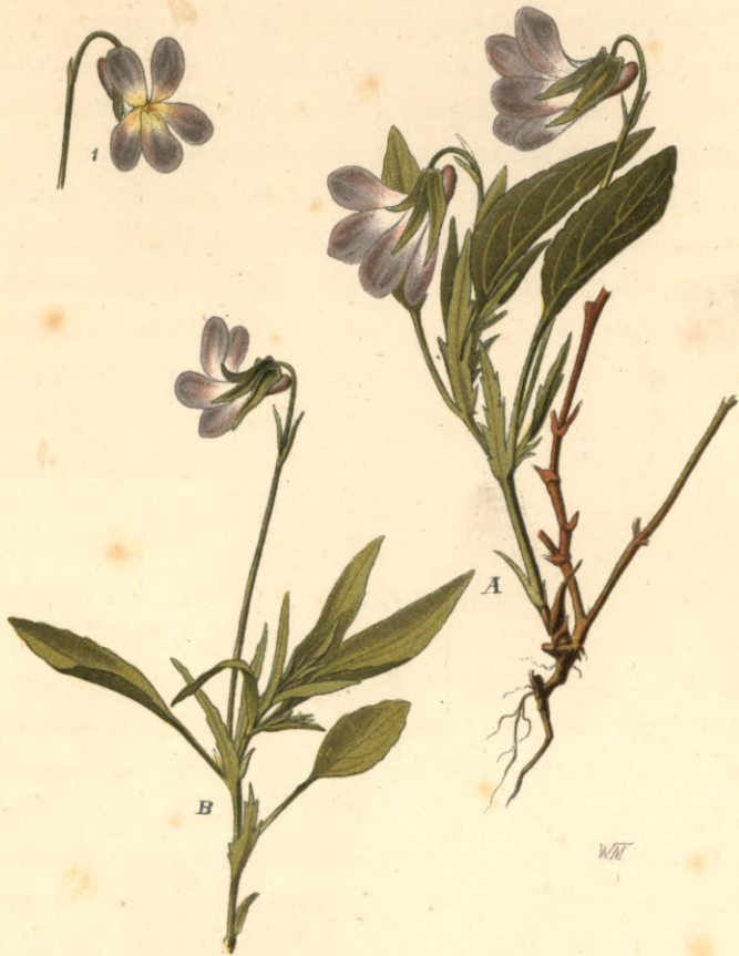
1280. Viola pratensis Moench. Wieseneißen.