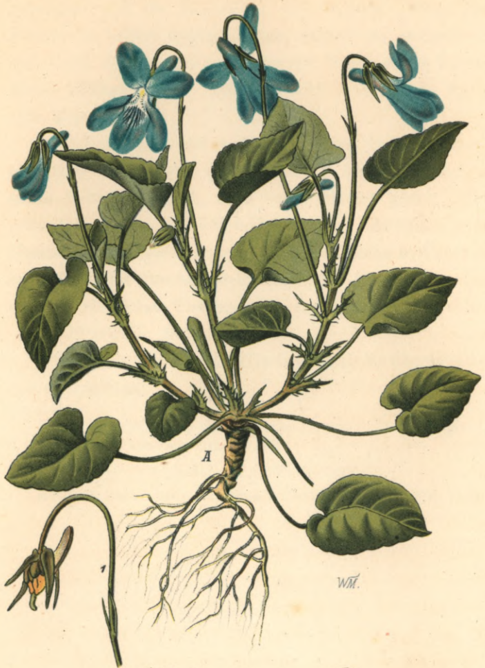
124. Viola silvestris Lamarque.