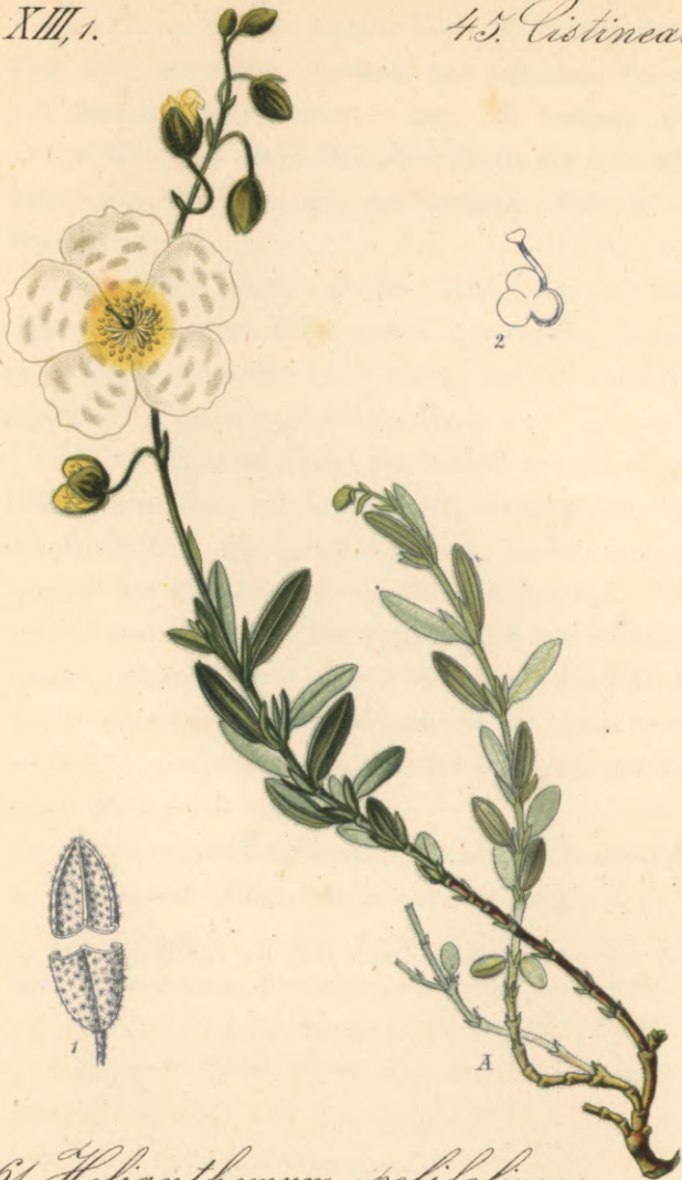
126. Helianthemum polifolium Poleiblättriges - Sonnenröschen. Koch.