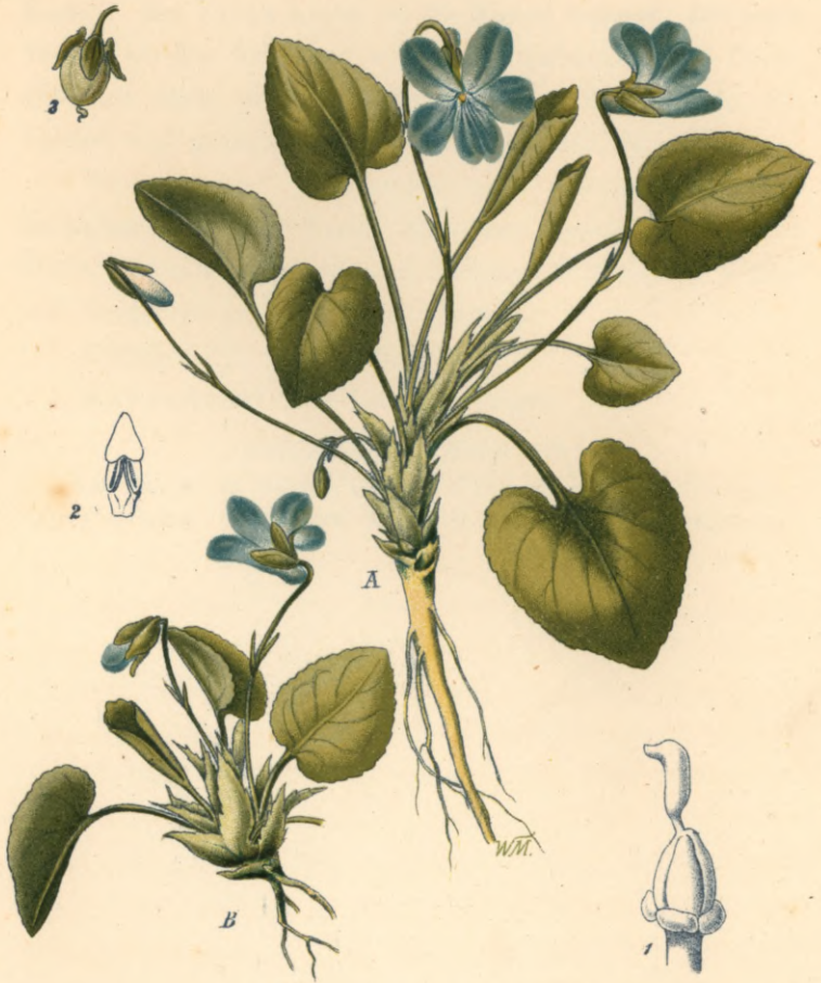
1266. Viola hirta L.