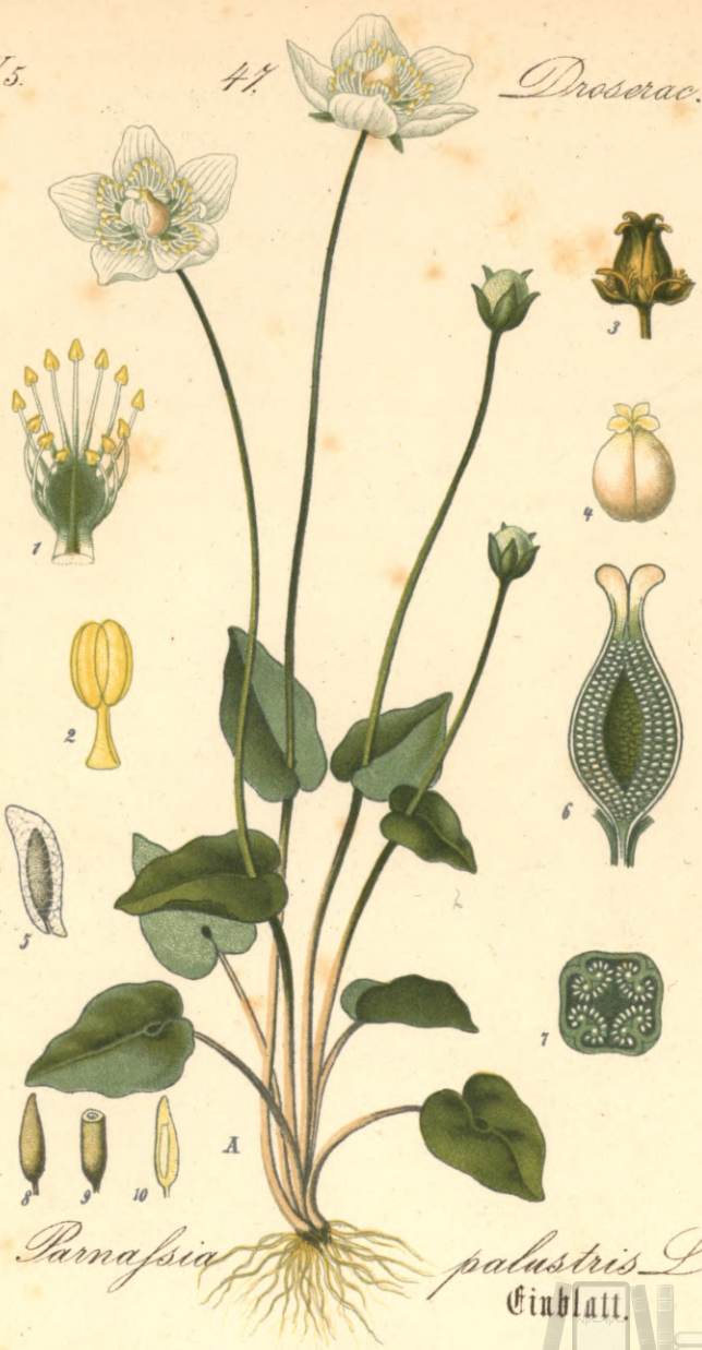
1293. Parnassia palustris L. Einblatt.