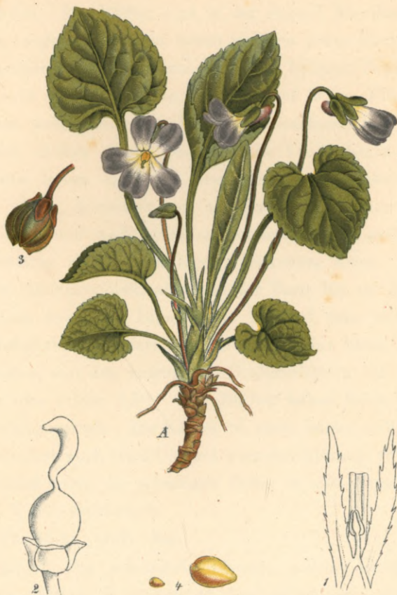
1269. Viola sciaphila Koch. Schattenliebendes-Veilchen