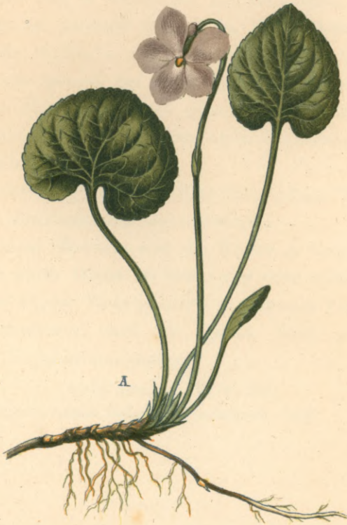
1264. Viola epipsila Ledebour. Torsveilchen.