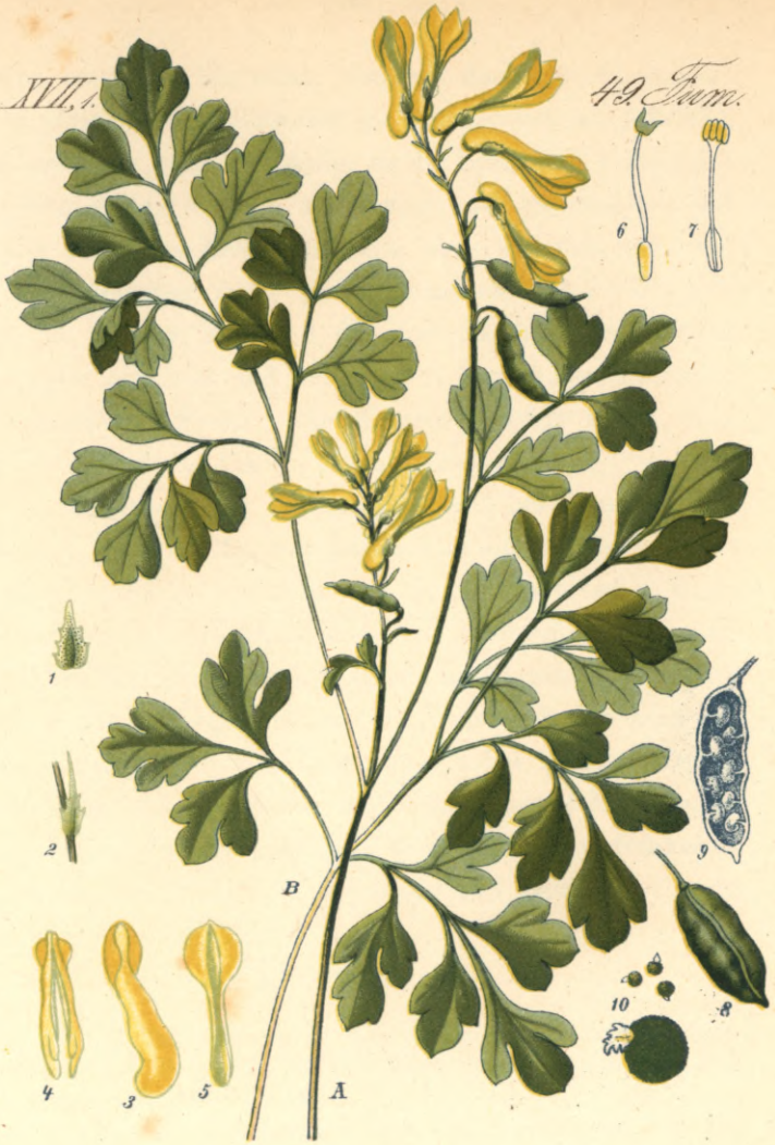
1309. Corydalis lutea D. C. Gelber- Erdrauch.