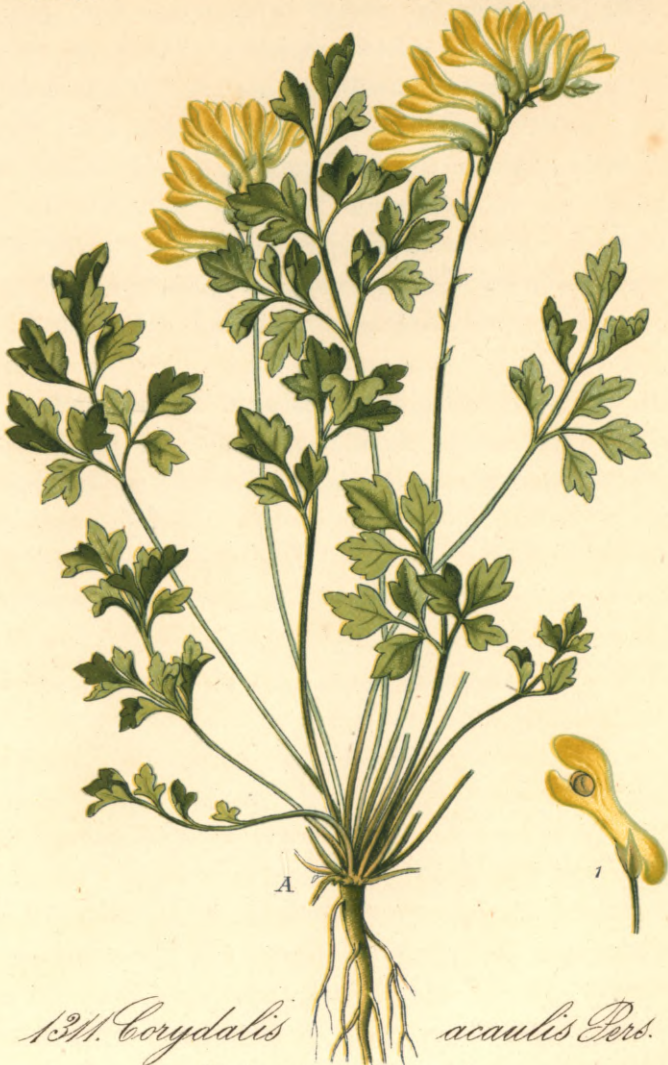
1311. Corydalis acaulis Pers. Niedriger-Erdrauch.