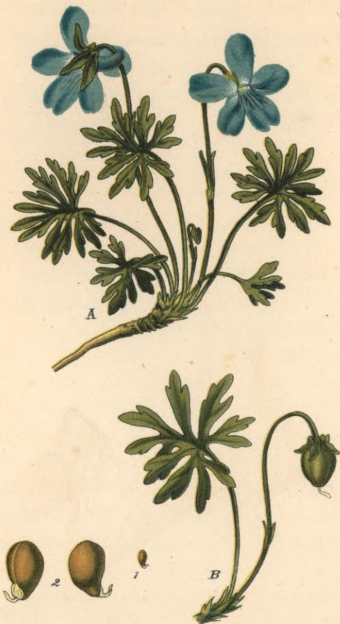
1262. Viola pinnata L. Fiederblättriges-Weilchen.