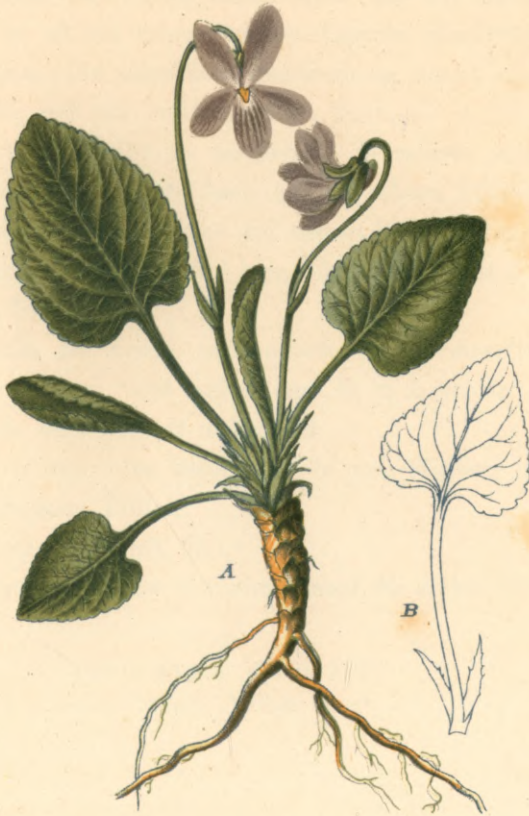
1268. Viola ambigua Met. K. Zweifelhaftes-Weilchen.