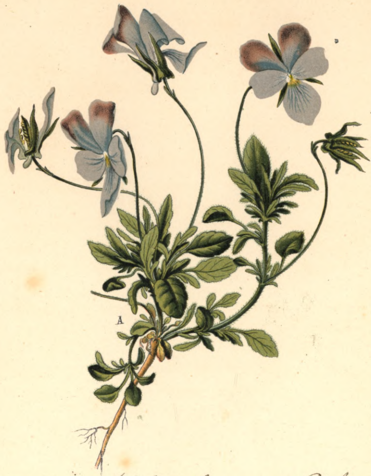
1284 III. Viola rothomagensis Desf. Behaartes - Stiefmütterchen.