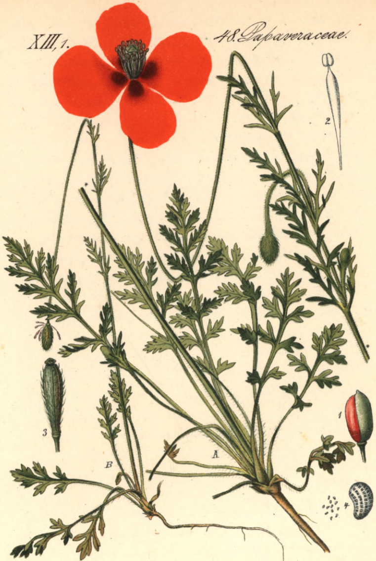
1296. P. Argemone L. Rauhfrüchtiger-Mohn.