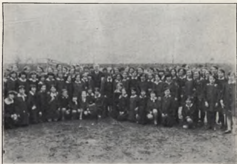
„Tydzień Dziecka” w 1929 r.