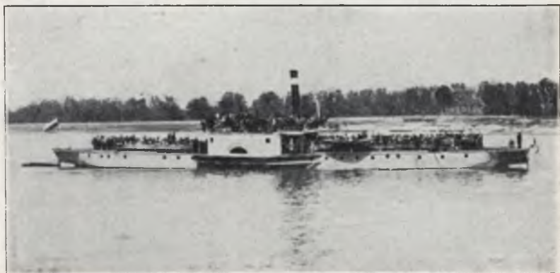
„Tydzień Dziecka“ w 1929 r.

Do dnia dzisiejszego sprawozdania z akcji nadesłały województwa: białostockie, nowogródzkie, poznańskie, warszawskie i st. m. Warszawa. Poleskie T-wo Kolonij Letnich, które organizowało „Tydzień Dziecka“ w woj. poleskim, nadesłało sprawozdanie bardzo ogólnikowe; prosiliśmy o szczegółowsze, obiecano nam, lecz dotąd nie dostarczono.