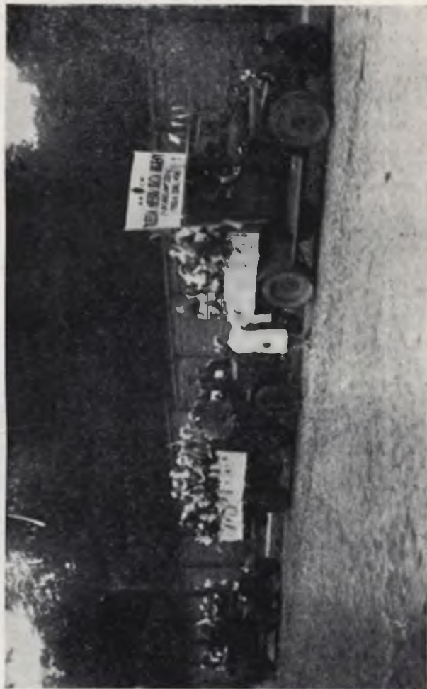
Warszawa. III Miejska Stacja Higieny Zapobiegawczej — Spokojna 15. Wyjazd dzieci na spacer po Warszawie.

Musimy stwierdzić, że, jeżeli chodzi o sprawozdania, to pomimo kilkakrotnych próśb i przynagleń, napływają one niezmiernie powoli. Jako ilustracja, może służyć fakt, iż za rok 1928 brak nam dotąd sprawozdań z województw: białostockiego, łanopolskiego, pomorskiego (kasowego) i krakowskiego (uogólniającego działalność całego województwa). Uniemożliwia to Pol-