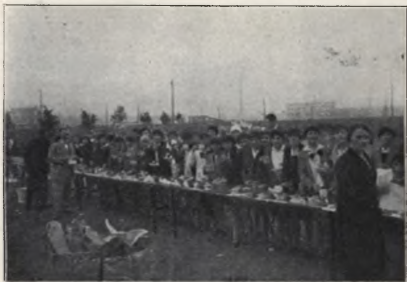
„Tydzień Dziecka” w 1929 r.