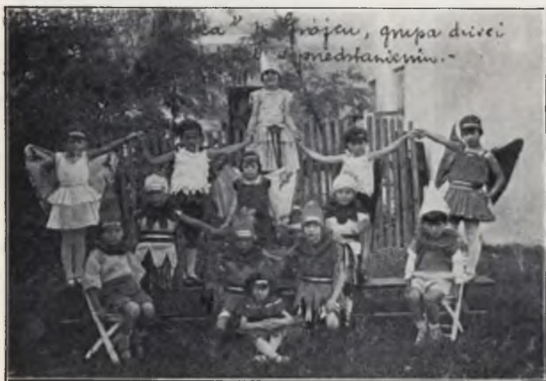
„Tydzień Dziecka” w 1929 r.

Pol. Kom. Opieki nad Dzieckiem wszystkim Komitetem Wojewódzkim rozesał: afisze, hasła (5 gatunków), książeczki „Nasze odczyty” i „Opuszczone”. Rachunki za te druki (zwrot kosztów) pokryły województwa: kieleckie, nowogródzkie, poleckie i wołyńskie. Pozostały jeszcze winne: białostockie, łódzkie, poznańskie i wileńskie.