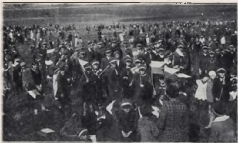
„Tydzień Dziecka” w 1929 r.