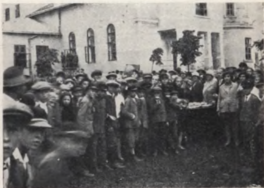
Grupa dzieci na podwieczorku w Śniatynie. „Tydzień Dziecka”.