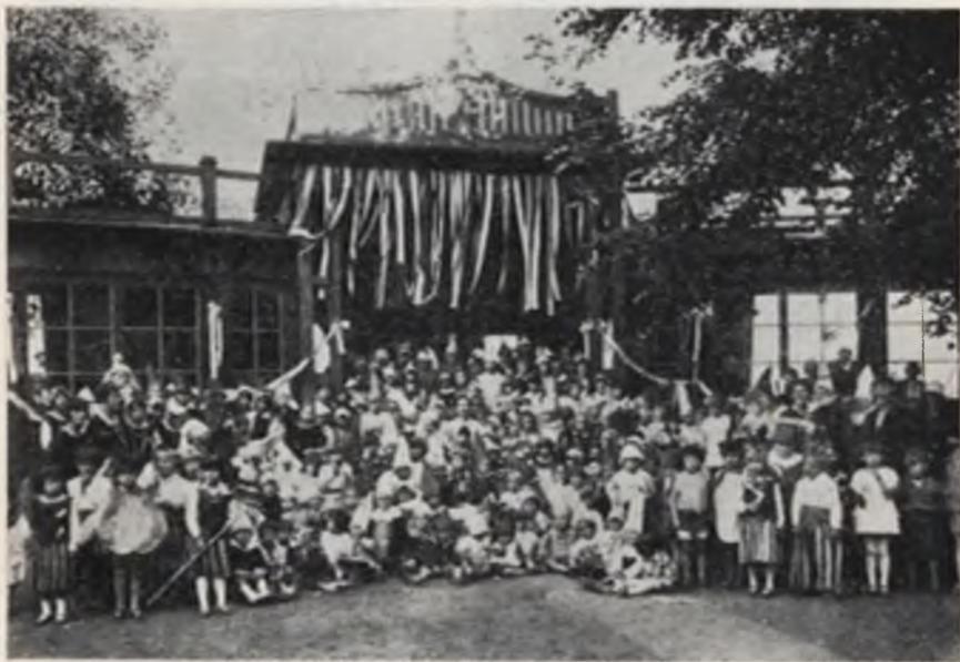
Warszawa. I Miejska Stacja Higjeny Zapobiegawczej — Puławska 91 „Święto Dziecka”.